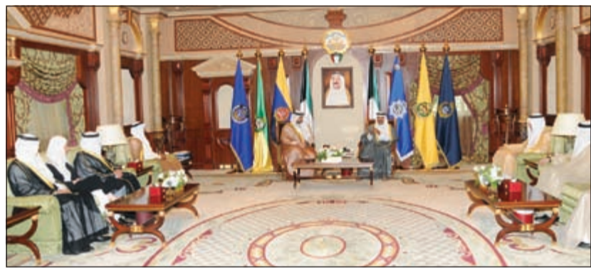
سمو ولي العهد لدى استقباله الشيخ محمد العبدالله ورئيس وأعضاء لجنة المناقصات المركزية

تعيينهم في مناصبهم الجديدة. وقد هناهم سموه متمنيا لهم التوفيق والسداد في أداء مهام عملهم، منوها سموه بدعم القيادة السياسية لهم وأن يعملوا بروح الفريق الواحد وبالتعاون والتكاتف وعلى مراقبة الله - عز وجل - وعدم التفرة بين الصغير والكبير من أجل خدمة ومصلحة وطننا العزيز وتحقيق الغايات المنشودة له، مؤكدا سموه على أهمية تطوير هذه اللجنة للربط بين متطلبات واحتياجات سوق العمل والتنمية الشاملة للبلاد تحت ظل القيادة الحكيمة لصاحب السمو الأمير.