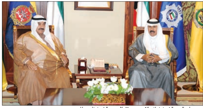
سمو ولي العهد الشيخ نواف الاحمد مستقبلا سمو الشيخ ناصر المحمد