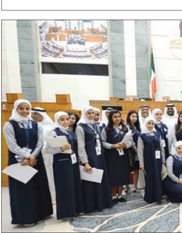
جانب من الطالبات المشاركات

بداية لا يوجد لدي متسع من الوقت فسوف أوجز بقدر المستطاع أولاً: الكويت من أعلى معدلات العالم في الإنفاق على التعليم ومع ذلك من آخر دول العالم في جودة التعليم والدليل الإحصائيات العالمية الموجودة في الوقت الحالي وهو ترتيب الكويت في العلوم الطبيعية يأتي بالمركز 124 وهي متأخرة جداً كما تراجع ترتيب الكويت في مؤشر محفزات الكفاءة وحلت المركز 83 والأسوأ من ذلك أن الكويت حلت بالمرتبة الـ 105 من حيث النظام التعليمي... دولة مثل الكويت معديها في الإنفاق على التعليم من أوليات الدول في العالم والنتيجة النهائية هذه نتائج الإنفاق.