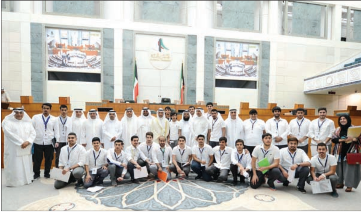
الرئيس الغانم متوسط الطلاب