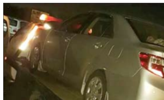
مركبة السائق المستهتر