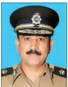
اللواء عبدالله المهنا

على ضبط الشباب الذي تبين أنه مواطن وأحيل إلى الحجز مع سيارته اليابانية، وأشار المصدر إلى أن رجال