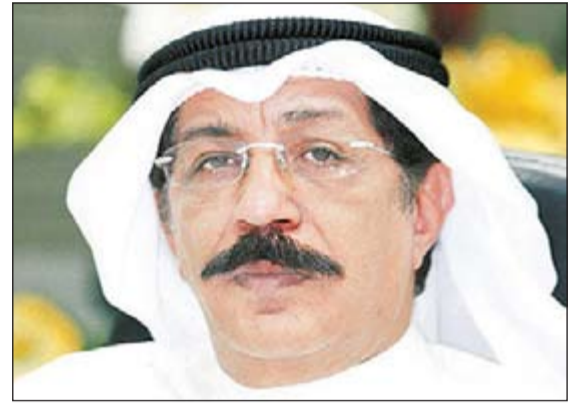
اللواء عبدالحميد العوضي