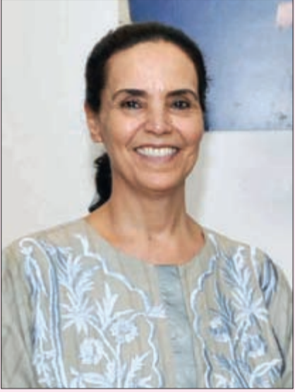
الشيخة أمثال الأحمد

رئيسة مركز العمل التطوعي الشيخة أمثال الأحمد، حصلت على بكالوريوس إدارة الأعمال من كلية التجارة والاقتصاد والعلوم السياسية في جامعة الكويت عام 1979، وشهادة الماجستير في إدارة الأعمال من كلية التجارة بجامعة عين شمس في مصر ولها مشاركات في العديد من المؤتمرات والندوات المتخصصة بالأمور البيئية، كما أن لها أنشطة كبيرة في مجال حماية البيئة في الكويت وأيضا في حملة ترشيد استخدام المياه وحاصلة على عضوية عدد من الجمعيات والمنظمات المحلية والدولية. كما أنها عضو في الجمعية الكويتية لحماية البيئة ورئيس فخري للجنة التنمية الصحية في مستشفى العدان في الكويت، وعضو في جمعية هواة الاسلكي، وعضو في لجنة فريق إدارة الأزمات والكوارث التابعة للهيئة العامة للبيئة والرئيس الفخري في اللجنة الوطنية للاتحاد العالمي لصون الطبيعة (IUCN)، وعضو في اللجنة البيئية المنبثقة عن الجانب الكويتي في اللجنة الكويتية-اليابانية لرجال الأعمال في ديسمبر 2003، وعضو في المجلس الاستشاري لكلية العلوم الادارية في جامعة الكويت منذ 4 مايو 2004، والرئيس الفخري للجمعية الكيميائية الكويتية منذ 18 ديسمبر 2004 وحاصلة العضوية الشرفية للهيئة الخيرية الإسلامية العالمية وذلك في يناير 2005 وجائزة الشخصية البيئية لمجلس التعاون بدول الخليج العربية لعام 2003-2004 وذلك في مارس 2005 وتتولى رئاسة اللجنة الاعلامية في اللجنة العليا للاحتفالات الوطنية.