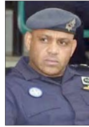
اللواء ركن صالح العنزي