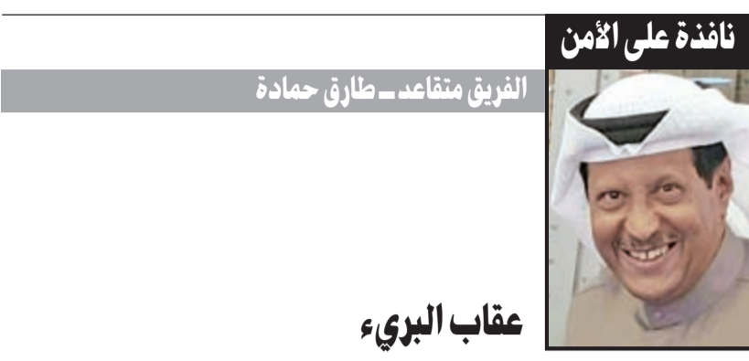
الفريق متقاعد - طارق حمادة

أمر مدير أمن محافظة الفروانية اللواء ركن صالح