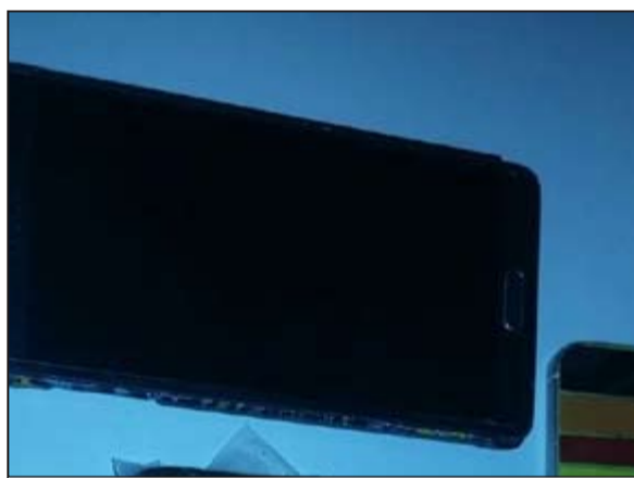
المضبوطات احيات والوافدين إلى «المكافأة»

قضت المحكمة الكلية بالزام مواطن بدفع 4 آلاف دينار لصالح ضابط في وزارة الداخلية وذلك تعويضا عن اساءته له أثناء تاديبته لواجبه العسكري. وأسند للمتهم أنه أهان بالقول المجنسى عليه الذي يعمل بوزارة الداخلية برتبة ضابط بالألقاب المبينة بالمحضر والتعدي عليه وذلك أثناء تاديبته وتوظيفته على النحو المبين بالتحقيقات،