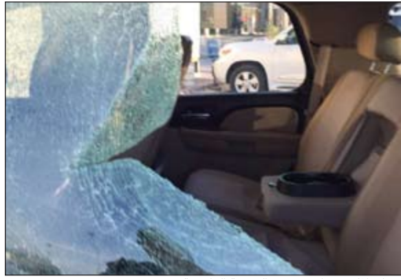
الزجاج المكسور كشف عن الهوشة الغامضة