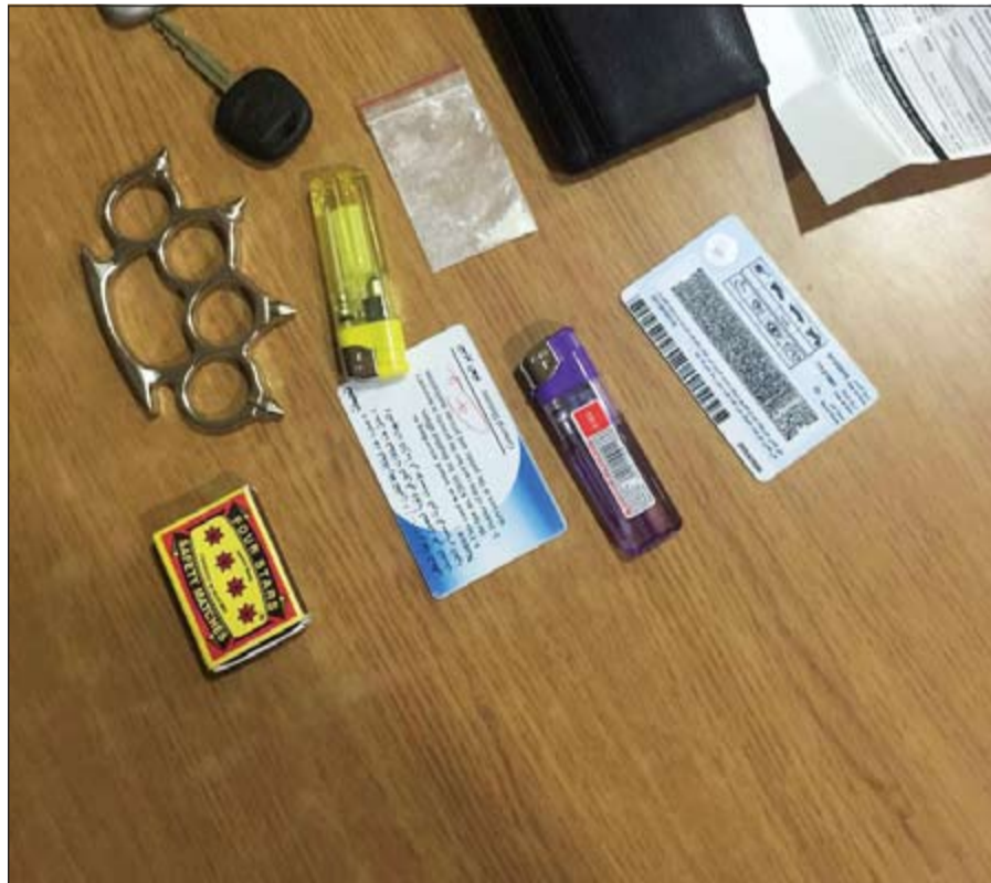
مخدرات وأدوات تعاط