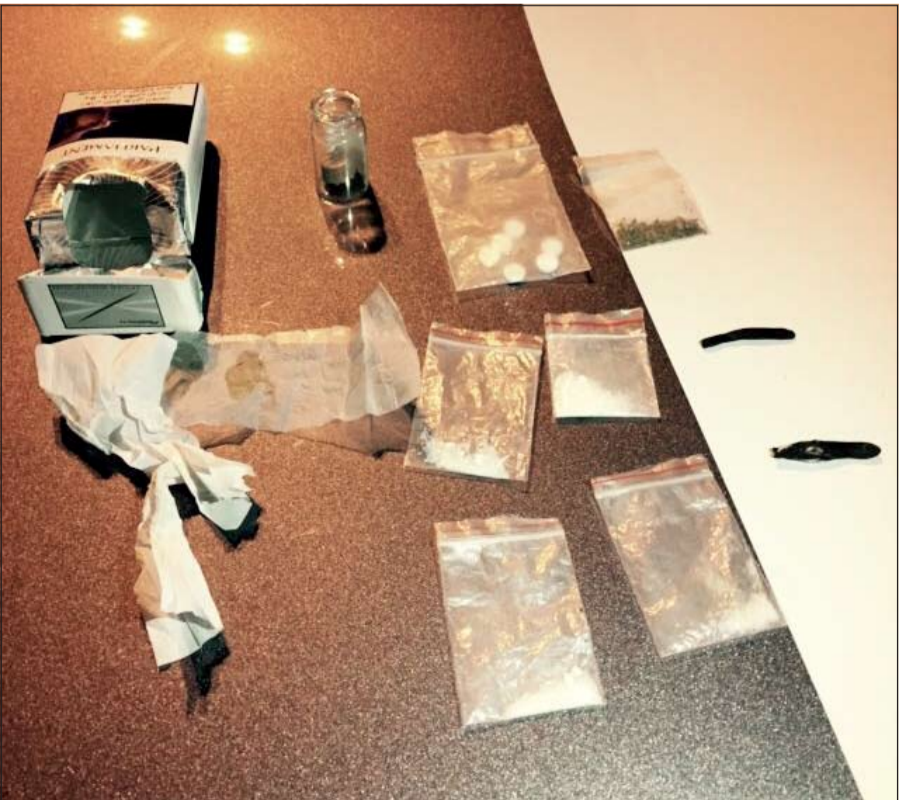
من المخدرات المضبوطة في حملات الأمن العام