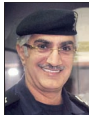
اللواء ابراهيم الطراح

دينارا وسيلاني مدين بمبلغ 593 دينارا وخليجي بحوزته مواد يشتبه في انها مخدرة. وفي إدارة عمليات الأمن العام قسم سرية المهام الخاصة تم ضبط مواطنين وخليجي وبحوزتهم مخدرات.