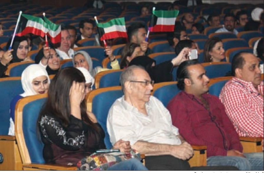
أعلام الكويت ترفرف في جامعة مصر

حيث تخرج في الجامعة العديد من الطلاب منذ إنشاء الجامعة سنة 1996.