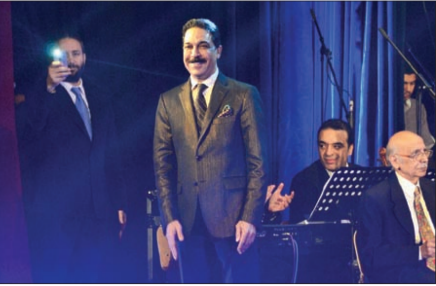
عبدالله الرويشد في الحفل (شريف عبدربه)