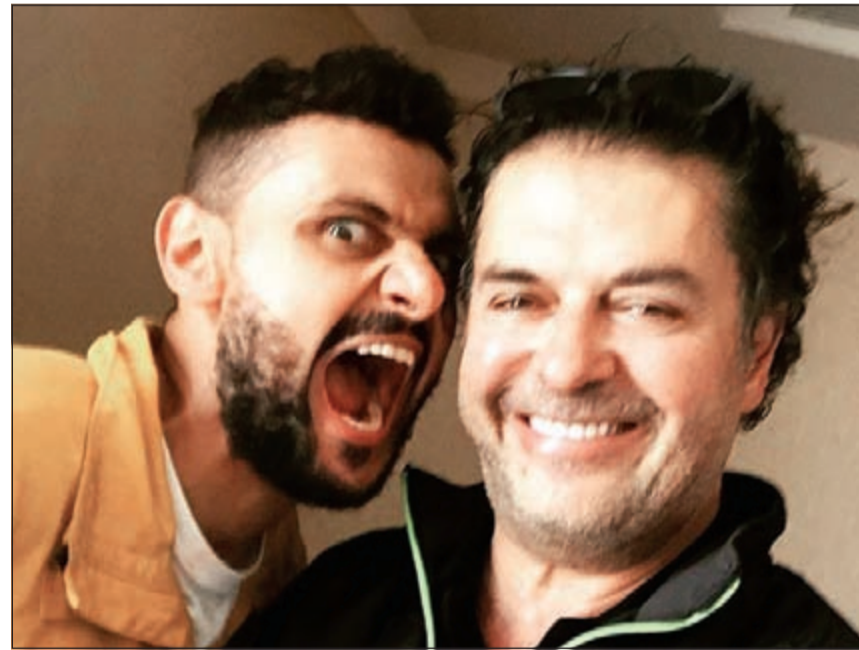
راغب علامة ورامز جلال

بعد خمس سنوات من المطاردة، نجح الفنان رامز جلال في خداع المطرب اللبناني راغب علامة، باعترااف الأخير الذي كشف بنفسه عن هزيمته هذه المرة، ووقوعه في فخ رامز الذي سيجعل عنوان «رامز يبلع بالناز» ومن المقرر عرضه في رمضان المقبل.