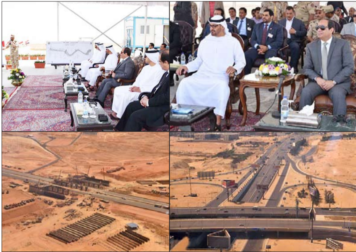
لقطات مجمعة للرئيس عبدالفتاح السيسي مع الشيخ محمد بن زايد آل نهيان ولي عهد أبوظبي ونائب القائد الأعلى للقوات المسلحة بدولة الإمارات العربية المتحدة خلال الجولة التفقدية لتجمع الشيخ محمد بن زايد (اليوم السابع)