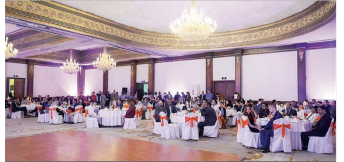
موظفو «النظاراتي حسن» خلال الحفل

وتشمل العروض خصومات كبيرة على الغرف تصل إلى 30% في عطلة نهاية الأسبوع، إضافة إلى تشكيلية من العروض المتنوعة على المطاعم. ويشمل عرض نهاية الأسبوع كذلك بوفيهات إفطار لذيذة ومختارة من أشهى الأصناف العالمية على قائمة مطعم «أتريوم» الشهير بفندق «كورت يارد ماريوت»، كما يضم الفندق كذلك العديد من المطاعم الأخرى منها المطعم الهندي المميز «سمول آند سبايس» والذي يقدم مزيجا رائعا من التوابل الهندية المحضرة بشكل عصري وحديث وقائمة طعام واسعة من الأطباق الهندية الأصلية حسب الطلب. إضافة إلى المطعم الياباني «سوشي» والذي يقدم أسد وأجود أنواع السوشي، الساشيمي والعديد من الأطباق اليابانية الشهيرة. ويمكن للزلاء المقيمين في فندق «جي دبليو ماريوت»