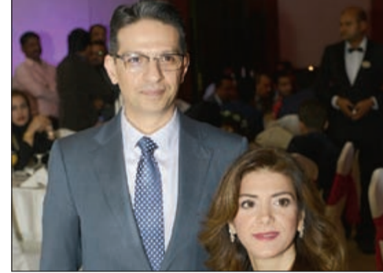
ديكان سعادت.. وحضور ميم