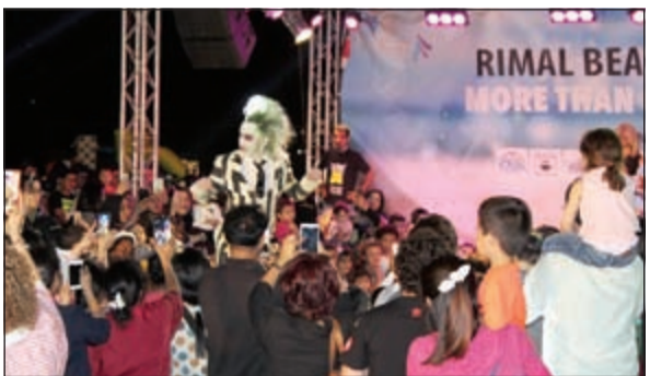
مشاركة واسعة من الأطفال