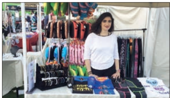
مشاريع بدوية صغيرة