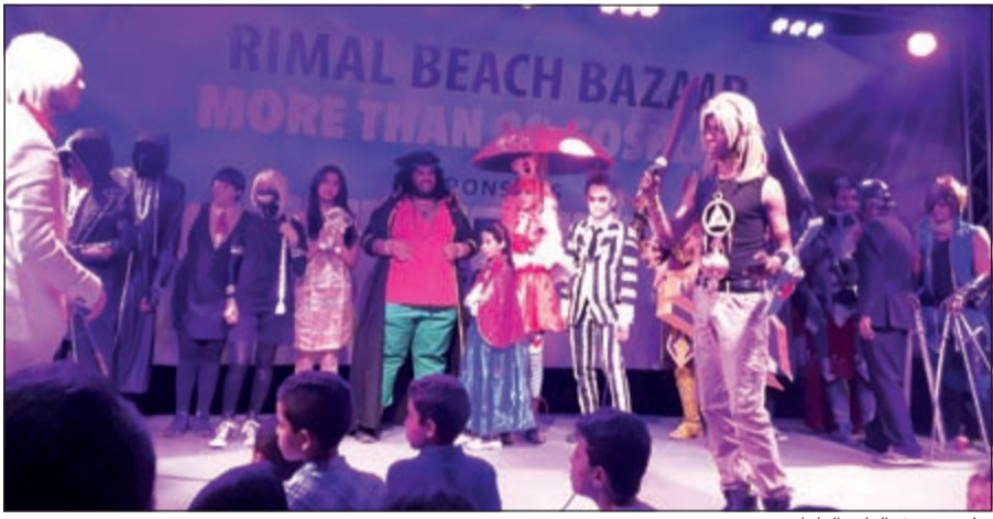
جانب من فعاليات البازار