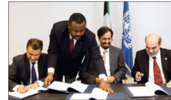
جانب من توقيع الاتفاقية بحضور السفير الشيخ علي الخالد

لبرنامج التعاون التقني، لتطوير القطاع الزراعي الوطني. ومن المقرر توقيع الاتفاقية الشاملة في الكويت الخريف المقبل لدى افتتاح «المكتب القطري للشراكات والاتصال» الذي يؤسس لشراكة إقليمية قطاعات الهيئة العامة الفنية، ما يشكل نواة «الاتفاقية الشاملة