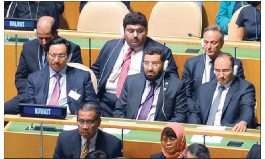
ممثل صاحب السمو الأمير الشيخ صباح الأحمد سمو رئيس الوزراء الشيخ جابر المبارك ود. علي العمير والسفير الشيخ سالم العبدالله والسفير منصور العتيبي خلال الاجتماع