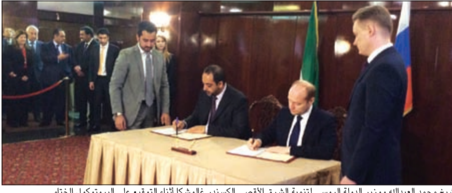
الشيخ محمد العبدالله ووزير الدولة الروسي لتنمية الشرق الأقصى الكسندر غالوشكا أثناء التوقيع على البروتوكول الختامي

العبدالله: رغبة متبادلة في تنمية العلاقات بين البلدين انعقاد الدورة الخامسة للجنة الكويتية - الروسية