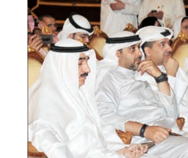
الشيخ محمد العبدالله ويوسف مصطفى ووليد الخشتي في مقدمة الحضور

عبدالله صامود أكد وزير الدولة لشؤون مجلس الوزراء الشيخ محمد العبدالله أن الكويت لن تتواني في دعم الطاقات الشبابية الهادفة، لاسيما من خلال إقامة مسابقة الكويت الكبرى للتصوير تحت رعاية سمو رئيس مجلس الوزراء الشيخ جابر المبارك وبمشاركة عدد من الفنانين العالميين و أبناء الكويت الذين اجتهدوا بها و تنافسوا منافسة شريفة مع اخوانهم من شتى أنحاء العالم.