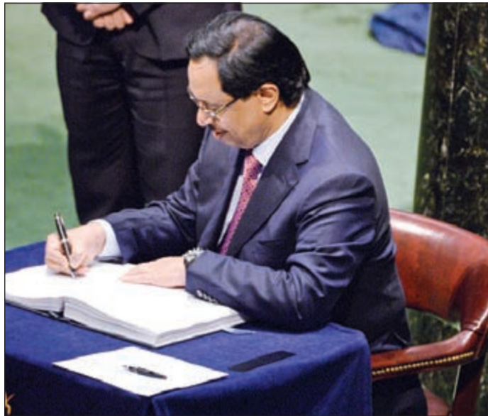
ممثل صاحب السمو خلال التوقيع على اتفاق باريس العالمي حول المناخ