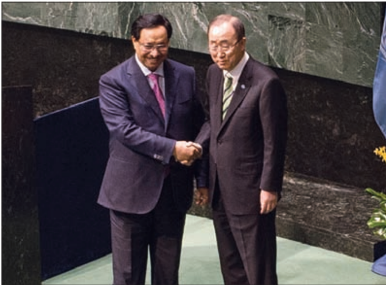
سمو رئيس الوزراء الشيخ جابر المبارك مصافحا الأمين العام للأمم المتحدة بان كي مون