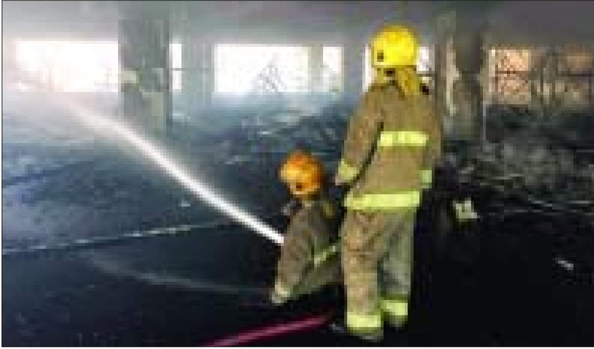
رجال الإطفاء يتعاملون مع الحريق بالسرداب