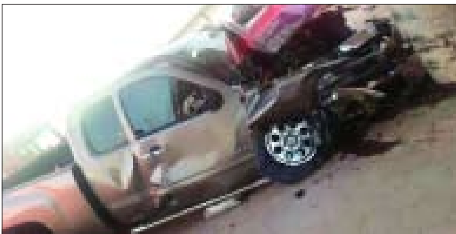
المركبة التي ضمت محشورين

في سياق متصل، ورد بلاغ الى غرفة عمليات الإدارة العامة للإطفاء عن اندلاع حريق في شقة بالدور السادس في عمارة مكونة من 9 ادوار وعلى الفور توجه مركزا اطفاء المنقف والفحيحيل الى الحادث وقامت فرقة المكافحة بالسيطرة على النيران واخمادها قبل انتشارها وقامت فرقة الانتقاذ باخلاء العمارة من السكان وعمل التهوية واقتصر الحادث على الخسائر المادية دون وقوع اي اصابات بشرية. كذلك ورد بلاغ الى غرفة عمليات الإدارة العامة للإطفاء امس يفيد بتعطل مصعد بمنطقة عبدالله المبارك.