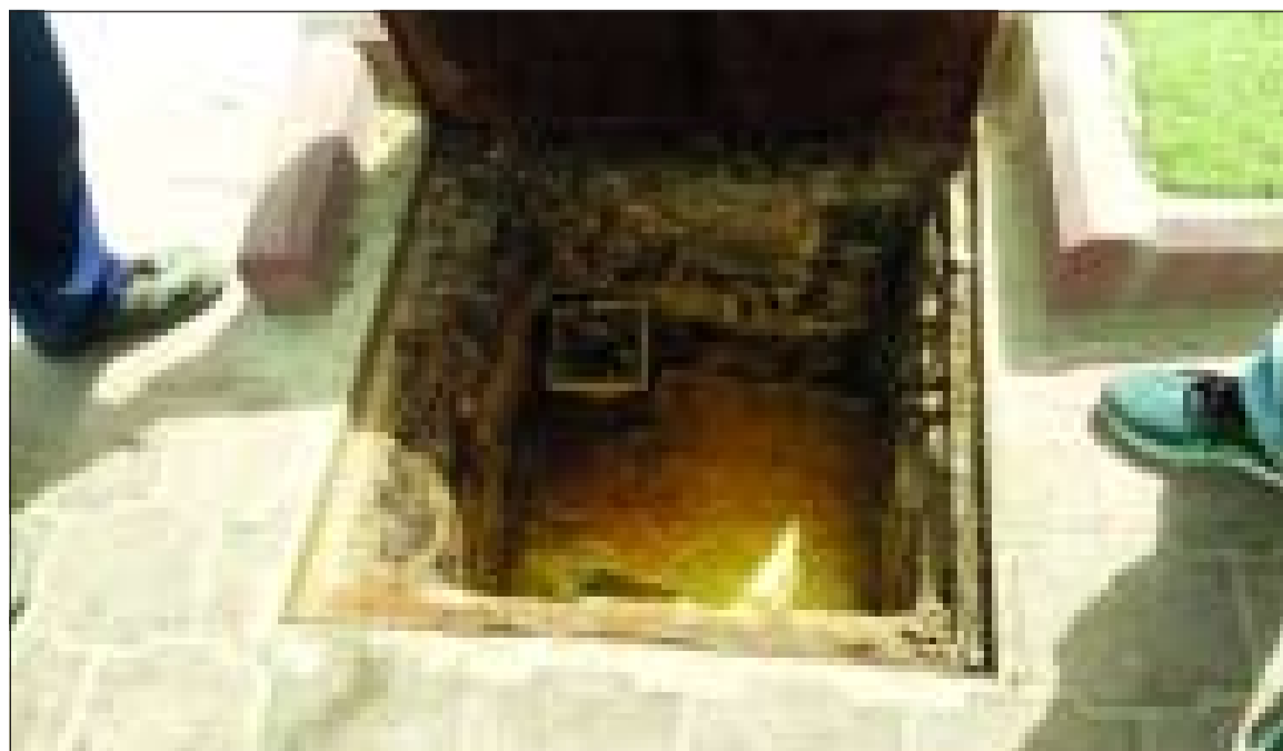
ممنول بدون مصاف