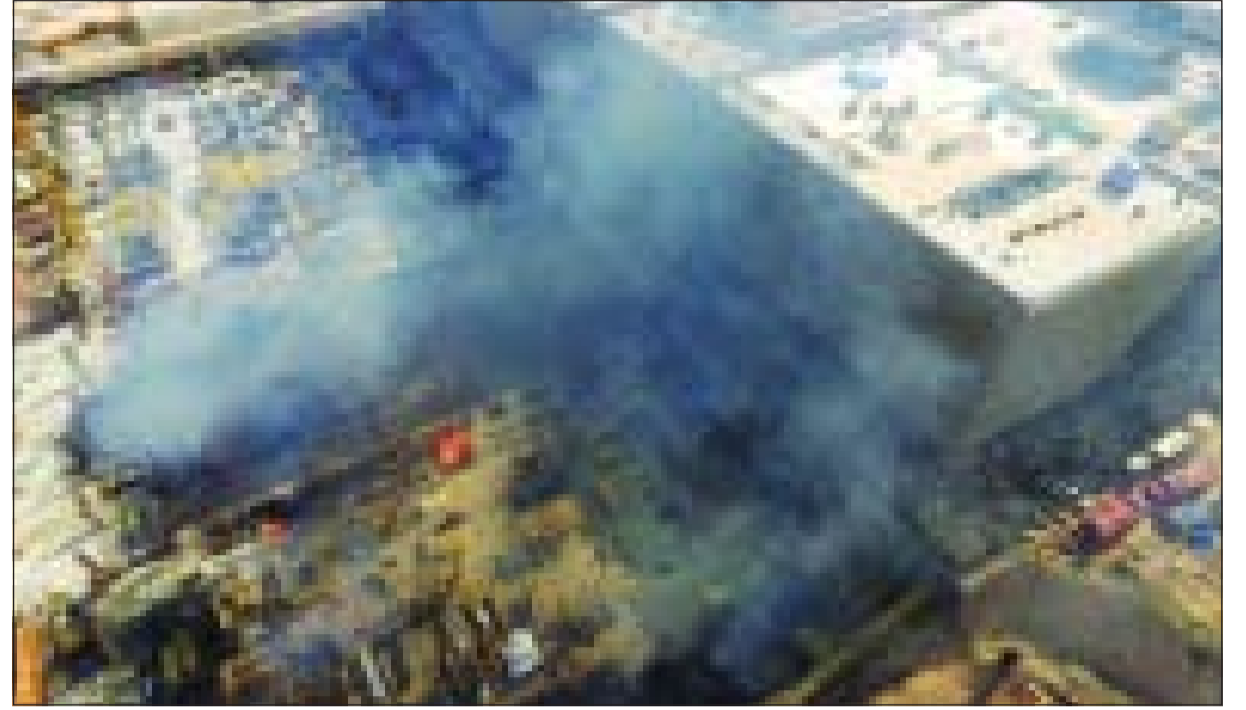
دخان الحريق يتصاعد