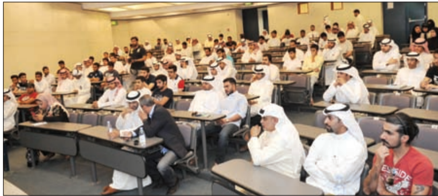
متابعة كبيرة من طلاب وطالبات قسم الاعلام لفعاليات الندوة

من جانبه أكد رئيس جمعية الإعلاميين الكويتية د.يوسف الخليفة على أن الصحافة الإلكترونية مرتبطة بتكنولوجيا المعلومات والاتصالات، لافتا إلى وجود بيئة اتصالية جديدة عالميا حول العالم ولم تقتصر وسائل الإعلام على الوسائل التقليدية بل أصبح هناك كسم هائل من المعلومات الإلكترونية اليومية. وأشار د.الخليفة إلى أن البيئة الاتصالية المتكاملة تعتمد على عدة عوامل منها حرية الصحافة والتشريعات الإعلامية بالإضافة إلى رأس المال، موضحا أن الصحافة الإلكترونية أثرت على المحليات في جريدة «دسمان نيوز» الإلكترونية، ليلبي القحطاني، أن الجريدة يجب ألا تقبل أي دعم من أشخاص أو مؤسسات حكومية لعدم التأثير على نهجها الإعلامي، مضيفة «لا أتوقع أن تزول الصحافة الورقية