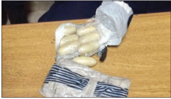
الهيروين المضبوط في باص النزلاء

هوية مجهول وضع نحو 20 كبسولة هيروين تزن نحو 200 غرام من الهيروين الخام بقصد إدخال الشحنة إلى السجن المركزي. وجاءت إجراءات اللواء الدين عقب تقرير أعده أمن المحاكم تضمن أن باص النزلاء والذي كان متجهاً إلى قصر العدل أخضع للتفتيش وعثر في أسفل أحد المقاعد على الكبسولات المعوية.