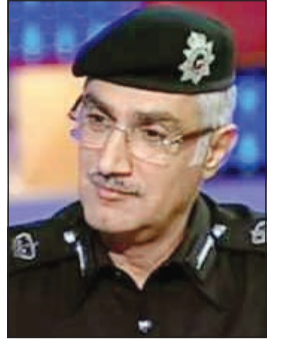
اللواء إبراهيم الطراح