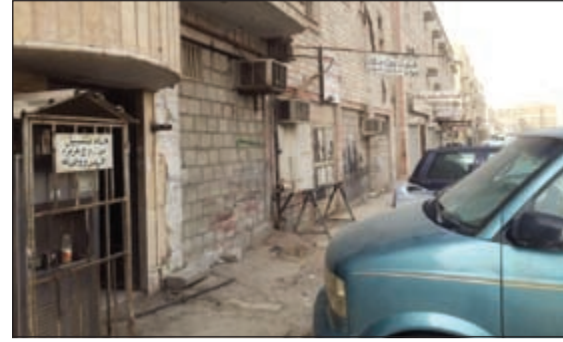
ابواب الورش أغلقت بطابوق