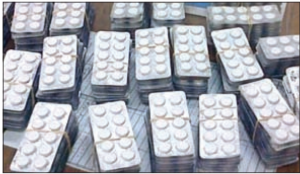
الحبوب المضبوطة بحوزة المتشبهين بالنساء

نقل شابان كويتيان أولاً إلى الإدارة العامة للمباحث الجنائية للتحقيق معهما في تهم متعلقة بالتشبه بالجنس الآخر على أن يحال لاحقاً إلى الإدارة العامة لمكافحة المخدرات لحيازة 160 حبة مخدرة. وقال مصدر أمني إن دورية أوقفت فئتين للاشتباه في قيادة المركبة تحت تأثير السكر، وتبين لرجال الأمن أن الفئتين شابان يرتديان الزي النسائي وعثر معهما على الحبوب. واقتيد واقندان مصريان إلى السدارة العامة لمكافحة المخدرات لمعرفة مصدر الحبوب والهيروين الذي ضبط بحوزتهما في ضبطيتين