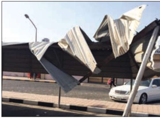
كانت مظلة قبل الاصطدام