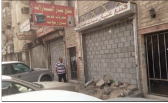
.. وعرضت للإيجار