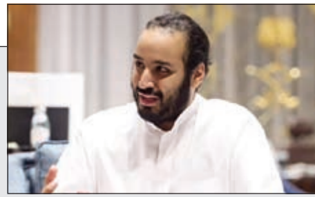
ولي ولي العهد السعودي صاحب السمو الملكي الأمير محمد بن سلمان