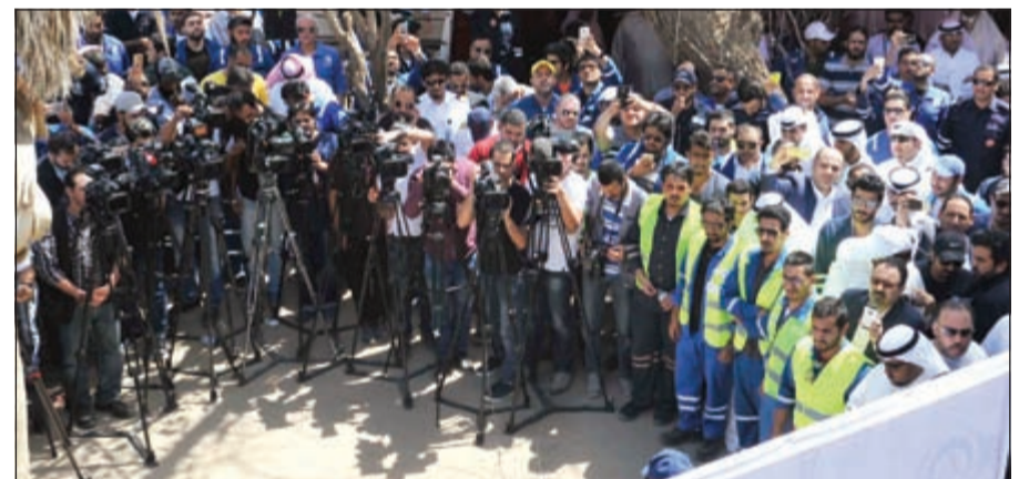
حضور إعلامي محلي وعالمي حاشد

حظي الإضراب الذي نظمته اتحاد عمال البترول صباح امس بتغطية إعلامية محلية وعالمية كبيرة لتغطية الحدث الذي وصف بأنه الأهم في الكويت والمنطقة بصفة عامة.