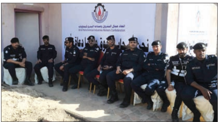
رجال الأمن بذلوا جهوداً مميزة في الحفاظ على أمن وسلامة المضربين

أشاد عدد من المشاركين بجهود رجال أمن محافظة الأحمدية وتعاونهم الكبير في حفظ الأمن وحماية العاملين المشاركين في الإضراب. ورغم كثافة العمال المضربين