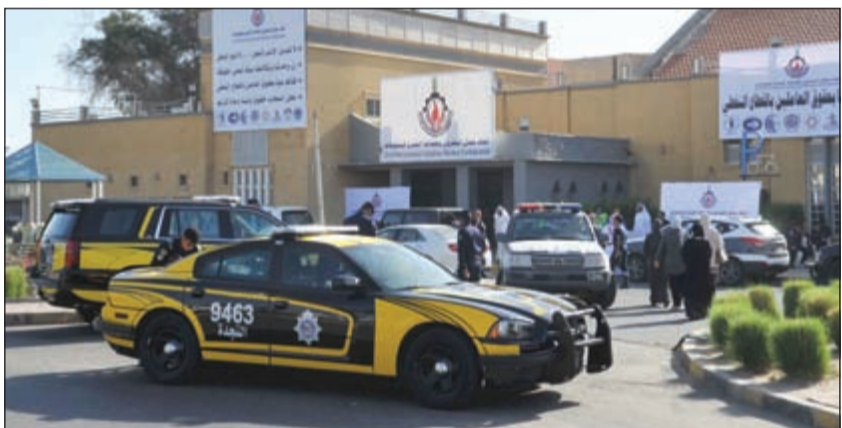
قوات الأمن بذلت جهوداً كبيرة لحفظ الأمن وتسهيل عملية المشاركة في الإضراب

وتابع: إن جميع الأمور طيبة ولا توجد أي إشكالات أمنية ولله الحمد.