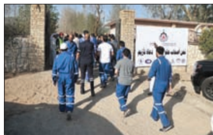
لقطة توضح بدء دخول المضربين عن العمل إلى مقر الاتحاد

أصدرت شركة نفط الكويت تعميماً أمس جاء فيه أنه وبالإشارة إلى الأحداث المتعلقة بمشروع نقابات عمال القطاع النفطي بالإضراب الشامل في كافة عمليات القطاع اعتباراً من الساعة 7:00 صباحاً من امس الأحد الموافق 17 أبريل 2016، ولما كان لذلك من أثر بالغ على سير عمليات شركة نفط الكويت، وتداعياته على الاقتصاد الوطني والاحتياجات اليومية للمواطنين والمقيمين، لذا فإن الشركة تعلن حالة الطوارئ -الحالة (2) (Declaration of Emergency)، والتي تتطلب قيام الشركة بتنفيذ وتفعيل خططها الموضوعة للتعامل مع حالة الطوارئ حسب النظم واللوائح ذات الصلة وحتى إشعار آخر.