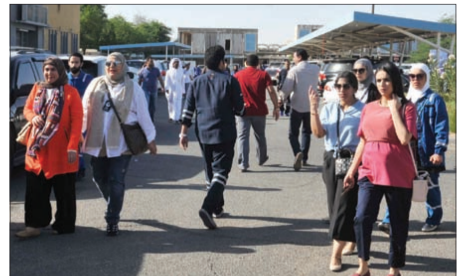
جانب من المشاركين في الإضراب

حظي الإضراب الذي نظمته اتحاد عمال البترول صباح امس بتغطية إعلامية محلية وعالمية كبيرة لتغطية الحدث الذي وصف بأنه الأهم في الكويت والمنطقة بصفة عامة.