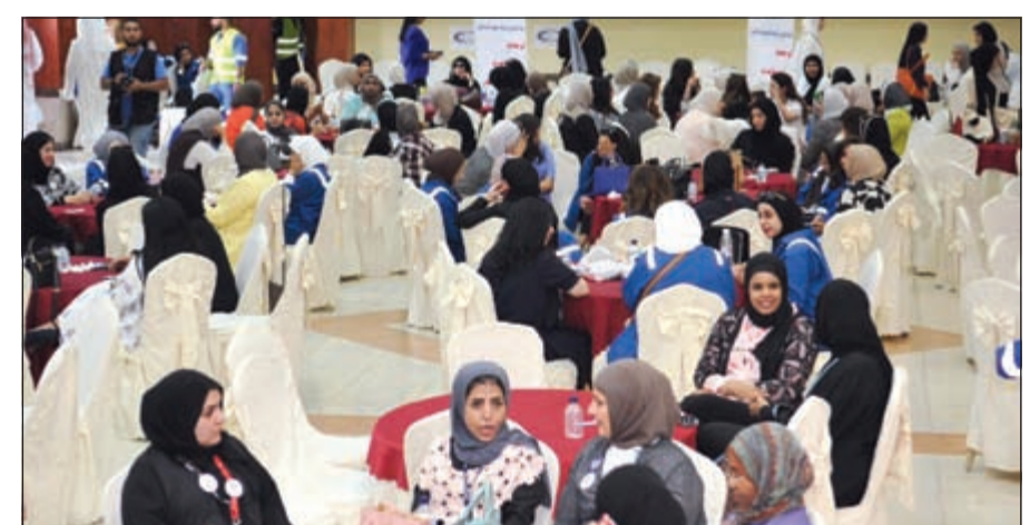
حضور نسائي كبير في الإضراب