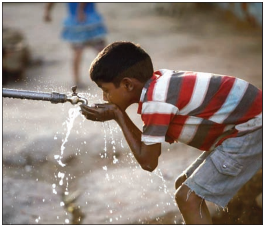
حكومات العالم مطالبة بإنفاق تريليونات الدولارات لتعزيز البنية التحتية للمياه

هناك نحو 400 شركة تعمل في حقل المياه حول العالم، وأن كثيراً من هذه الشركات مساهمة عامة تتداول أسهمها في البورصات العالمية، وأن الجانب الأكبر منها مهياً لتحقيق أرباح اعظم لاسيما أن المياه النظيفة الصالحة للشرب تتزايد ندرتها يوماً بعد يوم.