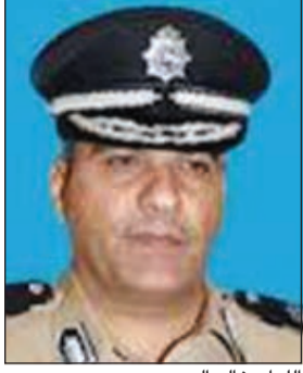
اللواء خالد الدبابس

واضاف الماجد في تصريح خاص لـ «الانباء» ان جهود تنفيذ الأحكام ممتدة إذ تمكن القطاع في العام 2014 من ضبط 1068 متهمًا من بينهم في قضايا جنائية و442 قضايا جنح و75 قضايا مروية.