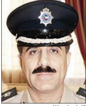
اللواء ماجد الماجد

واكد الماجد على ان ملاحقة المطلوبين تأتي في إطار حرص نائب رئيس مجلس الوزراء وزير الداخلية الشيخ محمد الخالد ووكيله الفريق سليمان الفهد على تنفيذ أحكام القانون مؤكداً على دعم الوزارة لسلطة تنفيذ القانون والإحكام الصادرة باعتبار أن مرحلة تنفيذ الأحكام من أهم المراحل الإجرائية القانونية التي تدعم سيادة القانون وتضفي عليه الفاعلية المتوخاة منه وتعد أيضاً من أسمى صور العدالة حيث لا جدوى منها إذ لم تجسد على أرض الواقع عن طريق تنفيذها بالطرق القانونية الصحيحة وبدقة متناهية امتثالاً لحجية الأحكام القضائية مما يدعم سلطة القانون الجزائي