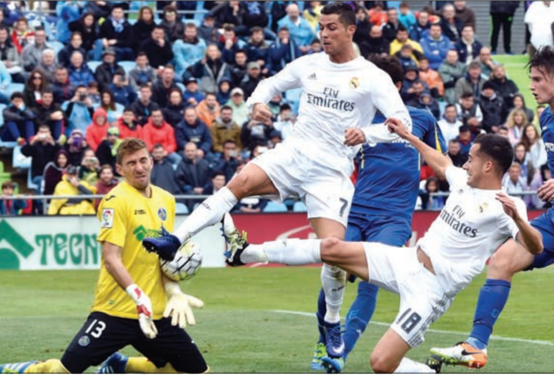
كرة ضائعة من أمام لاعبي ريال مدريد كريستيانو رونالدو ولوكاس فاسكوز

جاءت بداية الموسم فخر من الدور الأول في بطولة استراليا المفتوحة، ثم خسر أمام الصربي نوفاك ديوكوفيتش الأول في العالم في نصف نهائي دورة انديان ويلز بعدما خسر امامه في نهائي دورة الدوحة، ثم امام البوسني المغمور دامير دجومهور في الدور الثاني من دورة ميامي. ويواجه نادال، صاحب الرقم القياسي في عدد مرات الفوز بلقب هذه الدورة حيث توج بها 8 مرات متتالية بين 2005 و2012، اليوم في النهائي الأول له بعد 3 اعوام، الفرنسي غايل مونفيس الثالث عشر الذي تغلب على مواطنه