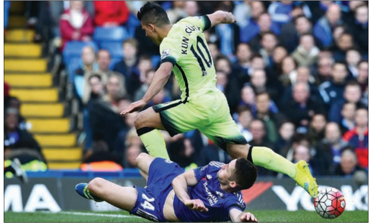
تجم مان سيتي سيرجيو أغويرو سجل «هاتريك»