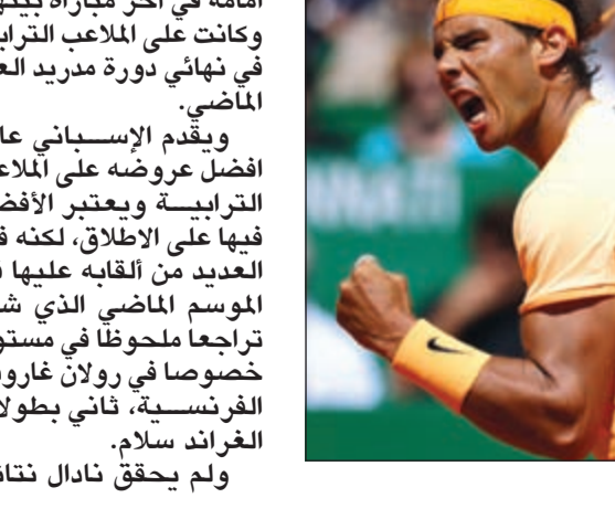
الإسباني رافاييل نادال