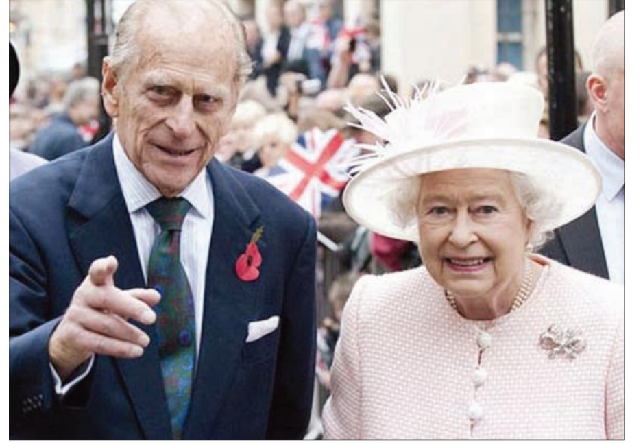
الملكة إليزابيث والأمير فيليب