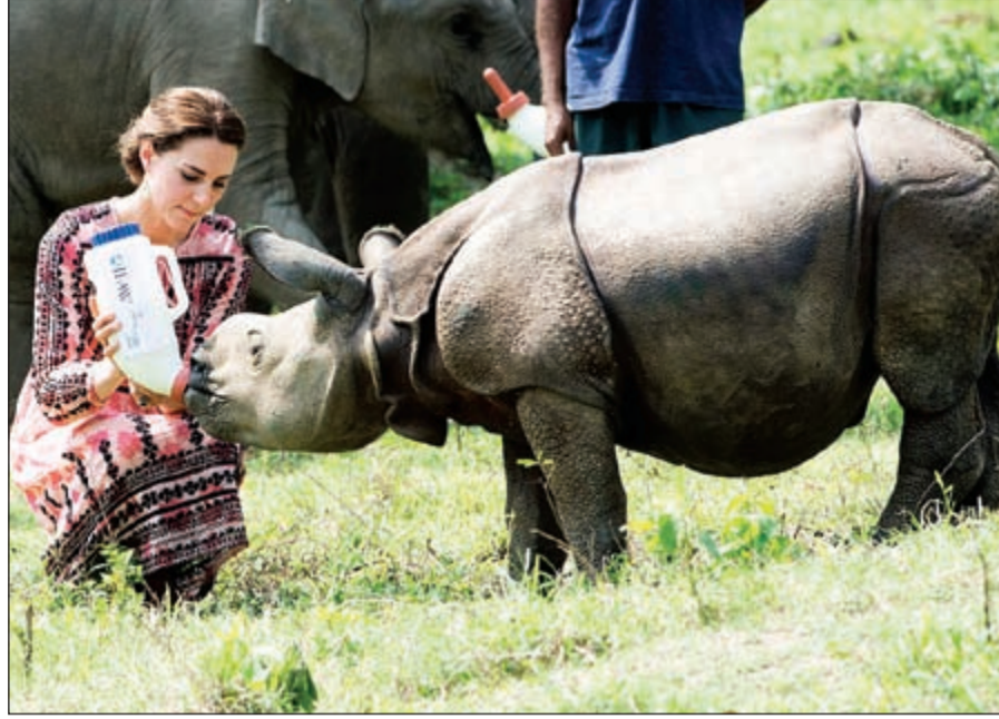
كيت ترزوع وحيد القرن

«أسوأ طلة للنجمة السمراء» مشاركون في حدث خيري بمدينة ساو باولو في البرازيل معلقين على رؤيتهم للنجمة العارضة السمراء ناعومي كامبل التي كانت حاضرة ومشاركة، حيث كانت بأسوأ إطلالة لها على الإطلاق من حيث الملابس الفوضوية وغير المتناسقة.