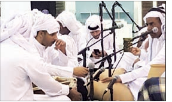
جانب من حفل الفرقة الشعبية