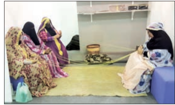
النساء وصناعة الكورار

بجولة في مختلف أقسام المهرجان، اطلع خلالها على ما تضمنه من عروضات مثلت «صناعة السلال» و«صناعة الكورار» وغيرها من الحرف اليدوية التي تجسد تقاليد و ثقافة البحرين وتراثها العريق، وأخيت الحفل الفرق الشعبية التي قدمت عددا من الألوان المختلفة من الفنون البحرية والشعبية القديمة، خصوصا «فن الصوت» الذي يميز التراث الشعبي الغنائي البحريني دون غيرها من الدول الخليجية. واشتمل المهرجان، الذي أبرز تراث البحرين بطريقة ذكية وبفكر واع لم يتم تناوله من قبل، على سوق لتقديم المنتجات التقليدية والمعاصرة والأطباق البحرينية التقليدية، إضافة إلى أماكن تعليمية خاصة للأطفال حتى يتعرفوا على تراثهم العريق.