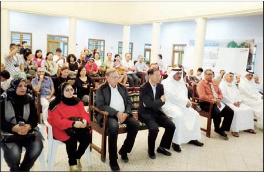
جانب من الحضور في المدرسة القبلية لمشاهدة فيلم «حياة بسيطة».