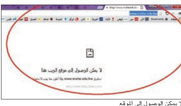
لا يمكن الوصول إلى موقع أرباب هنا