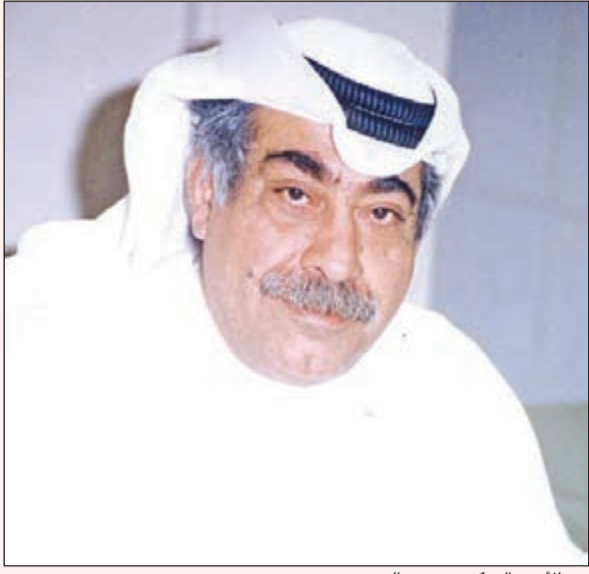
عبد الأمير التركي - رحمه الله

والمسرح والسينما. واستمر التركي في الإبداع من خلال كتابة نص المسلسل التلفزيوني الشهير «درب الزلق» عام 1977، وقدم عددا كبيرا من الأعمال المسرحية منها: «هذا سيفوه» و«مضارب بني نفض» و«ممثل الشعب» و«حامي الديار» و«حرم سعادة الوزير». ويعد أحد أبرز الكتاب الذين قدموا المسرح السياسي والاجتماعي في الكويت بأسلوب نقدي هادف، كما عرف بالكتابة الصحافية الملتزمة بقضايا الوطن.