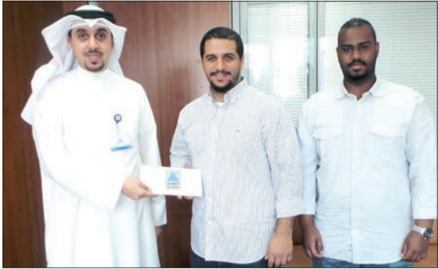
«الدولي» يقدم الدعم لأصحاب المشاريع المتميزة

طالب عدد من أهالي منطقة الشويخ السكنية ووزارة الصحة بضرورة زيادة العيادات التخصصية في مركز حمد الحمضي الصحي، لما لها من أهمية قصوى في خدمة أبناء المنطقتين الى جانب سكن الجامعة، مشددين على ان العيادات التخصصية ستحقق فائدة كبيرة وستوفر عناء الذهاب الى المستشفيات في الحالات البسيطة على عكس «برنامج طب العائلة التدريبي التخصصي» الذي يولد الازعاج للمرضى والمراجعين بسبب الازحام والضغط على حد وصفهم، وتمنى أهالي المنطقتين من وزارة الصحة أن تهتم بطلبهم من خلال العمل على انشاء العيادات التخصصية في المركز في اقرب وقت، وان تجد مكانا آخر لبرنامج طب العائلة، مشيدين بجهود الوزارة وجميع القائمين عليها وحرصهم على توفير سبل الراحة والعلاج للمواطنين وجميع المقيمين على ارض الكويت.