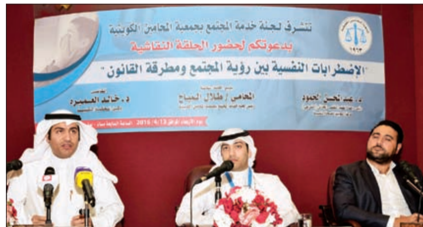
المحتجون في الندوة