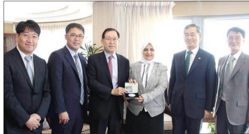
مند الصباح مستقبله الوفد الكوري

المجال، مشيرة الى وجود زيارات متبادلة بين البلدين خلال الـ 6 اشهر الماضية حول هذا الموضوع خصوصاً ان قانون التخطيط التنموي ينص على ضرورة عمل دراسات جدوى للمشاريع التي يتم تضمينها في خطة التنمية. وأكدت الصباح حرص امانة التخطيط على رفع نسبة الانجاز في خطط التنمية كما تحرص على تنفيذ هذا التوجه وان تستخدم من مختلف التجارب العالمية في مجال