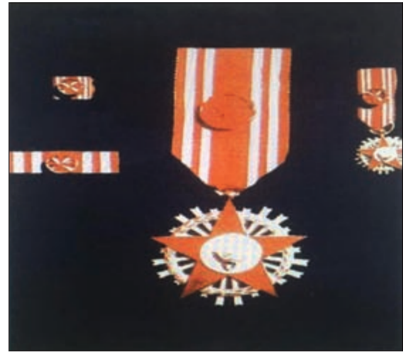
وسام الدفاع رتبة قائد

اعلن مصدر رفيع المستوى عن ان وزارة الداخلية رفعت الى الديوان الاميري قائمة باسماء الوية كخطوة أولى تمهيدا لتقليدهم وسام الدفاع الوطني برتبة قائد، على ان ترفع قوائم اخرى برتب عميد وعقيد ومقدم ورائد على دفعات وقوائم اخرى من الضباط من رتب ملازم وحتى نقيب تمهيدا لمنحهم رتبة فارس.