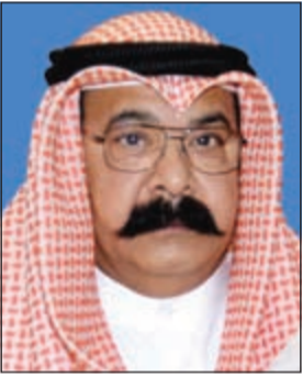
اللواء محمود الطباخ

طلب منه ان يتبعه وسيطبه خاطره ويسلمه سيارته، وبالفعل فعل الشخص ما طلب منه، واذ بالسائق يطلب منه 50 دينارا مقابل ان يسلمه السيارة، وان الشخص دفع له المبلغ الذي طلبه وأخذ سيارته من اعلى اللوش، وبمواجهة السائق بما انتهت اليه التحريات اقر بأنه طلب رشوة.