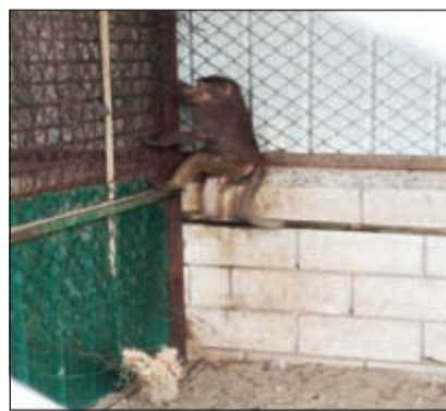
حظيرة قرود ضبطت في أحد الجواخير