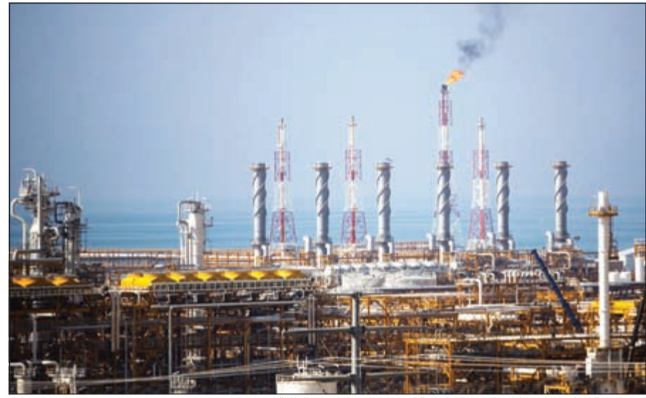
انخفاض النفط يدفع شركات النفط الخليجية لرفع كفاءة استخدام الطاقة

وأضاف الكاتب أن هذا الوضع قد تغير عام 1972 عندما استلمت الكويت 25٪ من شركة نفط الكويت، كما استحوذت الحكومة السعودية عام 1988 على آخر حصة أجنبية في شركة ارامكو السعودية. وخلال السنوات الواقعة بين هذين العامين، تم الاستحواذ على الصناعات النفطية في كل من البحرين والكويت والإمارات لتصبح مملوكة للدولة بالكامل، بينما تعتبر شركة تطوير نفط