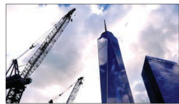
هل لا تزال الأسواق العقارية تمثل ملاذا آمنا للاستثمار؟

وتتوقع مؤسسة «جيه إل إل» زيادة في سوق العقارات التجارية تبلغ 17 مليون متر