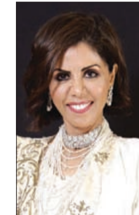
الشيخة سعاد الجابر