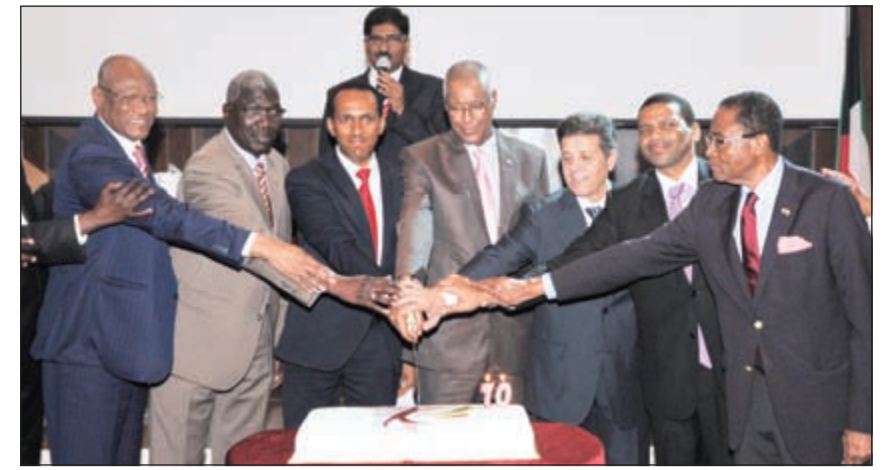
السفير الاثيوبي محمد جوديتا خلال قطع كيكة الاحتفال (ريليش كومار)