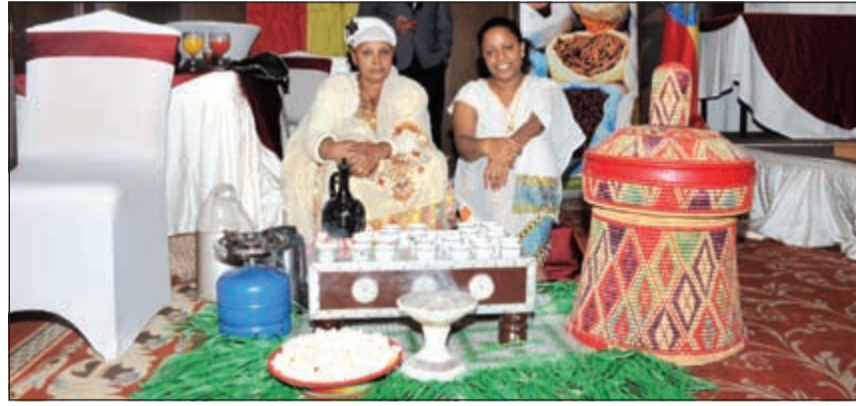
من التراث الإثيوبي

المصري، قال جوديتا: إن التعاون بين البلدين مثمر وتطور خاصة على صعيد الاجتماعات الثلاثية بين مصر وإثيوبيا والسودان، موضحا أن كل ما يثار للكويت لأسباب عديدة أبرزها إجراء تحسينات على مستوى العمالة تصب في مصلحة العامل وصاحب العمل، مشيرا إلى أن الكويت مكان ملائم للعمالة والشعب الكويتي ودود، معلنا أن الكثيرين من العمالة الإثيوبية يعيشون في أوضاع جيدة وظروف عمل مشجعة، ولكن هناك بعض المشاكل التي من الممكن أن تحدث مع أي جنسية أخرى. وعن سد النهضة والتنسيق المشترك بين الجانبين الإثيوبي