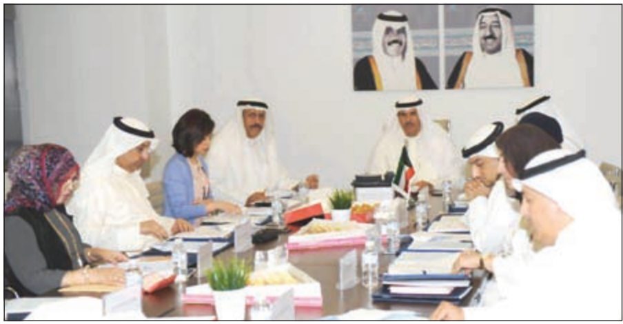
الشيخ سلمان الحمد مترئسا الاجتماع الثاني لمجلس إدارة هيئة الشباب بحضور الشيخة الزين الصباح و أعضاء المجلس