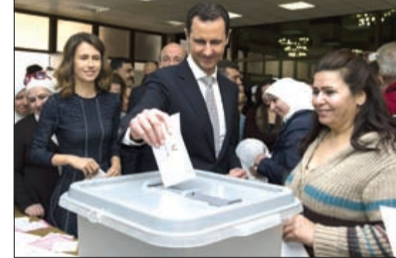
الرئيس السوري بشار الأسد وعقيلته أسماء بيليان بصوتيهما في مكتبة الأسد الوطنية الواقعة في ساحة الأمويين وسط دمشق أمس

عواصم - وكالات: استؤنفت أمس جولة جديدة من المحادثات غير المباشرة بين ممثلين عن الحكومة السورية والمعارضة في جنيف، في وقت شهدت المناطق الخاضعة لسيطرة النظام انتخابات تشريعية على وقع انقسامات غير مسبوقه وتصعيد عسكري يهدد بانتهاء الهدنة. واستهل الوفد الدولي الخاص إلى سورية ستانفاد دي ميستورا جولة المفاوضات الجديدة التي وصفها من دمشق قبل يومين بأنها «بالغة الأهمية» باجتماع عقده أمس مع وفد الهيئة العليا للمفاوضات المعارضة للسيطرة النظام. فيما رفض سوريون في مناطق المعارضة الاقتراع واصفين إياه بأنه «غير شرعي». وتنافس 3500 مرشح يزيد عمرهم على 25 عاماً لشغل 250 مقعداً في مجلس الشعب، وأقيمت مراكز الاقتراع في دوائر حكومية ومدارس وجامعات. وأدلى الرئيس السوري بشار الأسد وعقيلته أسماء بصوتيهما في مكتبة الأسد الوطنية الواقعة في ساحة الأمويين في وسط دمشق. وقال الأسد عقب التصويت: الانتخابات البرلمانية ضربة قوية للإرهاب.