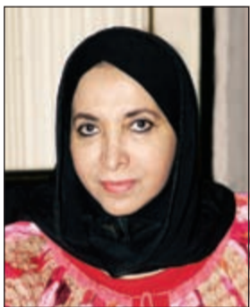
الشيخة د. سعاد الصباح

ماجدة الرومي والقيثارة: نوال نشاركان في تكريم د. سعاد الصباح ضمن الجلسة الختامية للملتقى الإعلامي العربي في دورته الجديدة