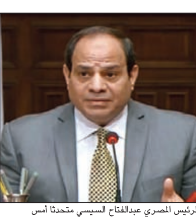
الرئيس المصري عبدالفتاح السيسي متحدثاً أمس

السعودية: ضوابط جديدة لـ الأمر بالمعروف والنهي عن المنكر