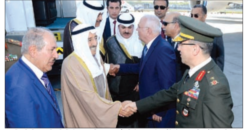
صاحب السمو الأمير الشيخ صباح الأحمد لدى وصوله إلى أنقرة ويبدو الشيخ صباح الخالد والشيخ خالد العبدالله

ولم يتوقف المجلس عند هذا الحد، بل استطاع اتخاذ قرار برفض منح الحكومة حق زيادة الرسوم بقرار منفرد من جانبها، وذلك من حيث المبدأ، على اعتبار أن مثل هذا الإجراء يعتبر غير دستوري. كما رفض المجلس قانون زيادة الرسوم مقابل الانتفاع بالمرافق والخدمات العامة وأحال وثيقة الإصلاح المالي إلى اللجنة المالية لدراستها خلال أسبوعين ثم إحالتها إلى الحكومة مع تكليف لجنة الأولويات ومتابعة التعويضات البيئية.