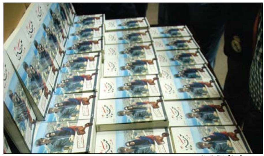
نسخ من الرواية خلال الحفل