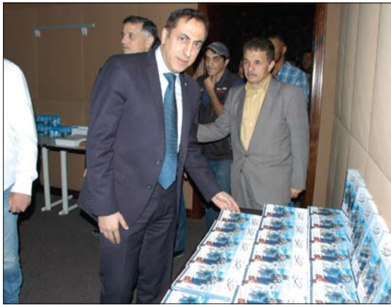
السفير اللبناني ماهر الخير لدى حضوره حفل التوقيع