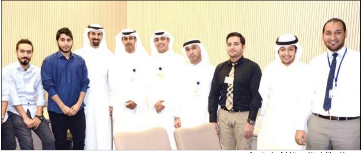
من موظفي «الأهلي المتحد» المشاركين في الدورة

متميزة تتناسب مع متطلباتهم واحتياجاتهم وتساعد على إنجاز معاملاتهم المصرفية بما يتناسب مع ظروفهم. وأشاد أمين بالإقبال والاهتمام اللذين أبداهما موظفو البنك الأهلي المتحد بدورات تعلم لغة الإشارة، موضحاً أن نجاح هذه الدورات لا شك سينعكس إيجابياً على تطوير قدراتنا في التعامل مع عملائنا من ذوي الاحتياجات الخاصة. وأكد أمين أن البنك الأهلي المتحد وإدارته التنفيذية لا يبالون جهداً في سبيل تعزيز القدرات والمهارات المختلفة لكوادره البشرية، وهو ما ينعكس على النجاح المتواصل في كسب ثقة عملائنا من مختلف الشرائح والفئات.