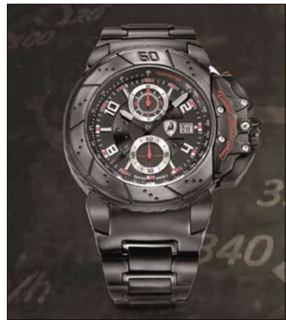
إلى المنتج النهائي. وقد أفرع روائع جنيف لجميع تشكيلاتها وخاصة لدى فرع مجمع الرابطة.

كن عنوانا للتميز واقتن ساعات Tonino Lamborghini العصرية المعصمة بروح الشباب الإصدار الجديد من ساعات Tonino Lamborghini الرجالية التي تناسب شخصية الرجل الأنيق المواقب للعصر وأخر صيحات الموضة الشبابية في واحد ليمتيز في مجتمع ومحيط أعماله بارتدائه تحفة من الماركة العالمية أيقونة الأناقة والرفي Tonino Lamborghini.