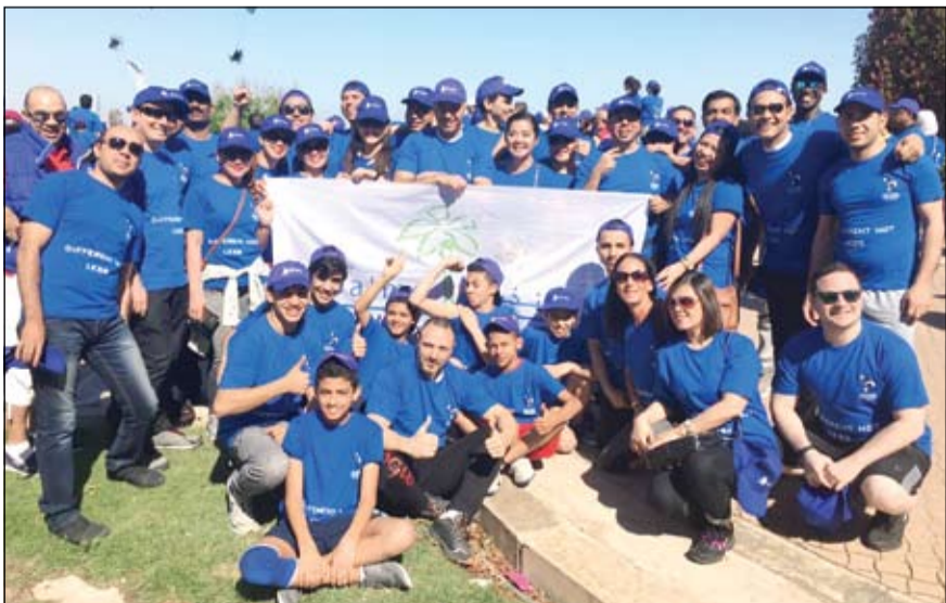
لقطة تذكارية للمشاركين بالمسيرة

عمل فندق ومنتجع شاطئ النخيل عن سعادتهم البالغة بحضورهم لهذا الحدث الرفيع المستوى وكونهم عنصرا فاعلا في انجاح المسيرة لإيمانهم التام بأن التوحد هو حالة قابلة للتعديل.