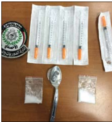
المخدرات وادوات التعاطي التي ضبطت بحوزة المواطنة