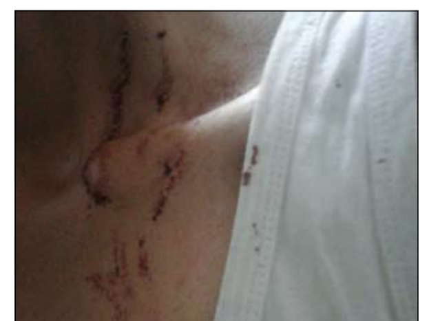
آثار الاعتداء تبدو بوضوح على طالب ضابط

وقعت مشاجرة عنيفة بين الطلبة الضباط الكويتيين المتعثري في دولة السودان من المستجدين في السنة الأولى مع طلبة سودانيين في الخرطوم.