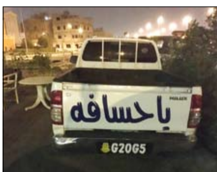
مركبة ضبطت بعد رصدتها بالاستهتار على شبكات التواصل