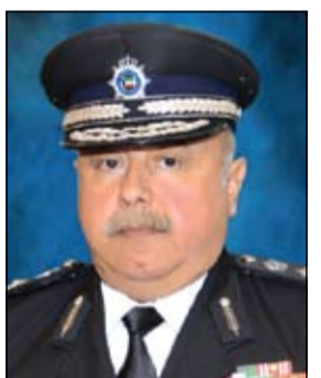
الفريق سليمان الفهد

وأشار السى الخطوات الإجرائية والتنظيمية التي تم اتخاذها في اعداد وحدات سكنية كاملة الخدمات المعيشية والترفيهية داخل نطاق منطقة السجون والتي في البيت العائلي للزوجة والأبناء والوالدين وأشقاء وشقيقات النزبل حيث روعي فيها امتداد الزيارة الى 72 ساعة كحد اقصى تخضع للوائح والنظم المعمول بها من حيث مدى التزام النزبل بحسن السير والسلوك والانضباط وعدم ارتكاب مخالفات تؤدي الى حرمانه من كل او بعض تلك الخدمات الإنسانية والاجتماعية للزيارة والتي تتطلب الالتزام بالتعليمات والارشادات خلال فترة قضاء العقوبة. وبين الفريق الفهد ان مشروع البيت العائلي تتم ادارته