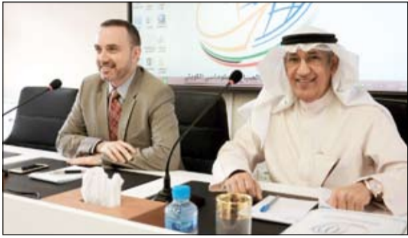
السفير عبدالعزيز الشارخ والسفير الفرنسي كريستيان نخلة

استضاف معهد سعود الناصر الصباح الدبلوماسي بعد ظهر امس السفيرين الفرنسي والمصري كريستيان نخلة وياسر عاطف. ورحب مدير عام المعهد السفير عبدالعزيز الشارخ بالسفيرين، مشيدا بما ربط على الدوام بين مصر الشقيقة والكويت من علاقات اخوة راسخة في كل المجالات، واصفا العلاقات بين البلدين بانها تميزت على الدوام بالتعاون والوفاء والصفاء، كما اشاد السفير الشارخ بالعلاقات الكويتية - الفرنسية، مؤكدا انها بنيت على اساس متينة من الصداقة والتعاون الذي يشمل كل جوانب العلاقات بين البلدين.