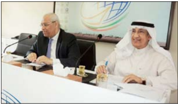
السفير المصري ياسر عاطف يشارك في محاضراته بحضور السفير عبدالعزيز الشارخ