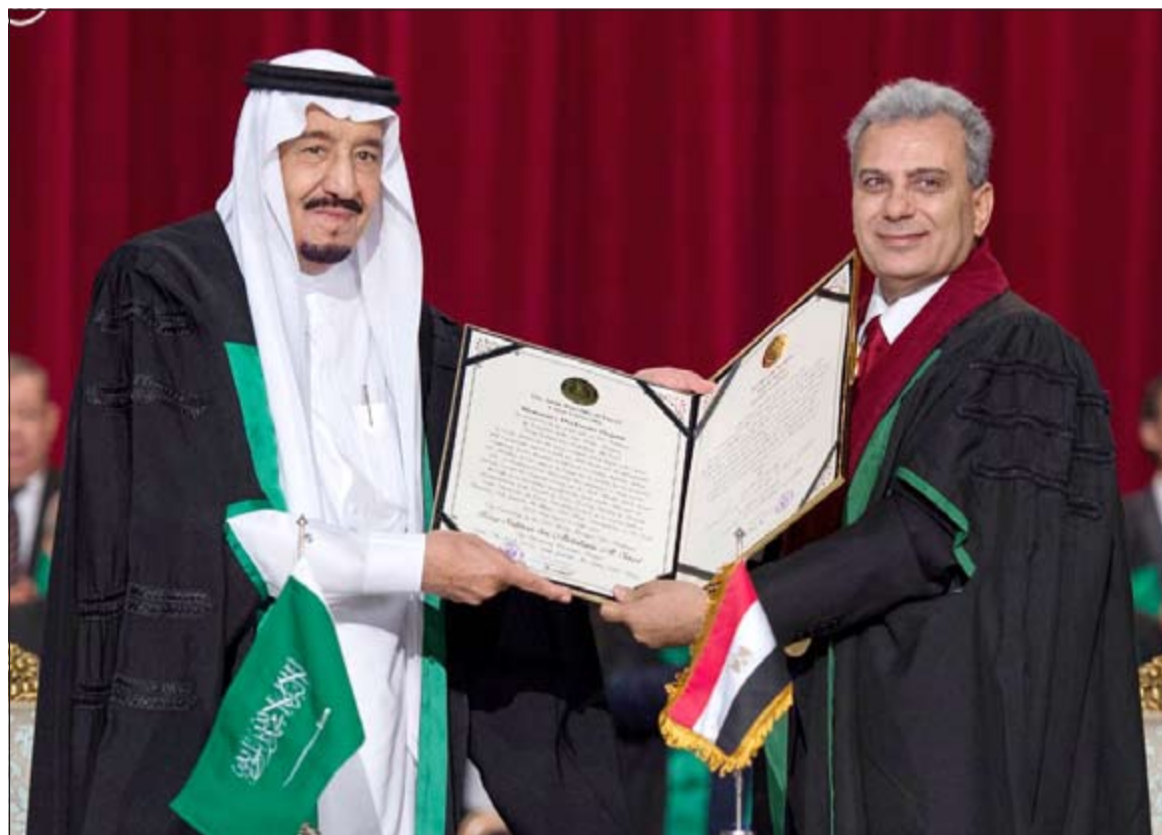
خادم الحرمين الشريفين الملك سلمان بن عبدالعزيز يتسلم الدكتوراه الفخرية من رئيس جامعة القاهرة نجابر نصار (واس)

القاهرة - أ.ش.أ: غادر خادم الحرمين الشريفين الملك سلمان بن عبدالعزيز القاهرة أمس بعد انتهاء زيارته التاريخية للقاهرة الأولى منذ توليه الحكم حيث كان الرئيس عبدالفتاح السيسي في وداعه بمطار القاهرة الدولي بعد زيارة استمرت 5 أيام وشهدت توقيع العديد من الاتفاقيات ومذكرات التفاهم. وقد حرص الرئيس السيسي، والملك سلمان، على رفع أيديهما متشابكتين وذلك للدلالة على العلاقات الطيبة بين البلدين، وعلى أن مصر والسعودية يد واحدة في مواجهة التحديات، وذلك قبل صعود الملك سلمان إلى الطائرة ومغادرته القاهرة متجها إلى تركيا. وقد اختتم الملك سلمان زيارته بتسلم الدكتوراه الفخرية من رئيس جامعة القاهرة د.نجابر نصار بوصفه شخصية عالمية وإسهاماته الفياضة في خدمة العروبة والإسلام والمسلمين ومساندته لمصر وشعبها ودوره البارز في دعم جامعة القاهرة بما يؤدي إلى تمكينها من أداء رسالتها وذلك في احتفالية كبيرة بحضور رئيس الوزراء م.شريف إسماعيل وعدد من الوزراء ورؤساء الجامعات وأعضاء مجلس جامعة القاهرة وعدد من كبار المسؤولين.