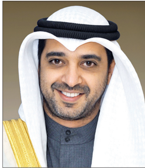
الشيخ محمد العبدالله

كما أعلن مدير عام الجهاز المركزي لتكنولوجيا المعلومات بالإشارة أن الجهاز سيستحدث جائزة الخدمة الإلكترونية المتميزة والمتوافرة على البوابة الإلكترونية الرسمية للكويت (www.e.gov.kw). وقال الشطي بهذا الصدد: «لقد تم استحداث هذه الجائزة لتكون جزءاً أساسياً من إطار العمل المشترك بين الجهاز وكافة الجهات الحكومية المعنية، وكذلك بين تلك