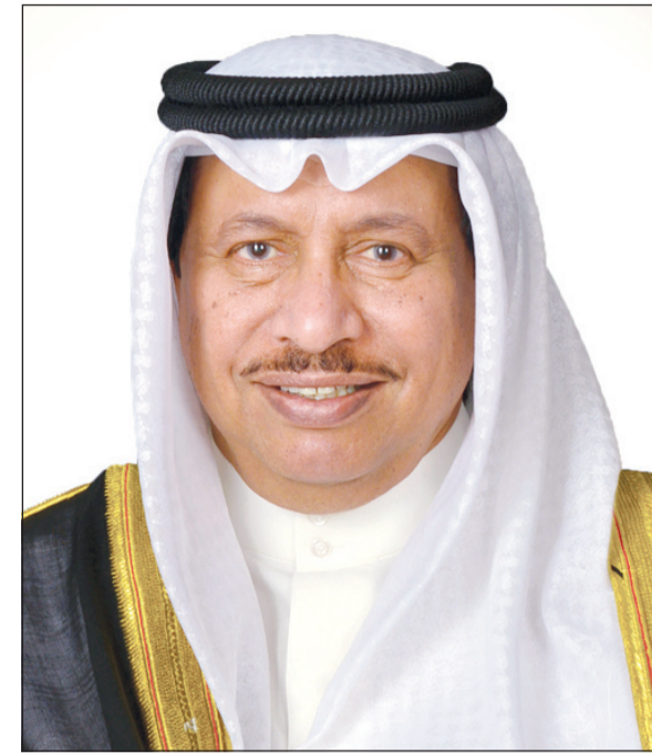
سمو رئيس مجلس الوزراء الشيخ جابر المبارك

وأضاف الشطي قائلاً: «ستتمثل الخدمات الإلكترونية