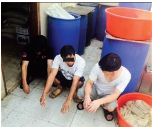
المضبوطون في مصنع السناتر

ج.م هندي الجنسية وكان بحالة غير طبيعية وعند تفتيشه احترازي تبين انه في جيبه الايمن، عدد 2 كيس يشتمه بها مواد مخدرة (هيروين)، عدد 1 «زقارة» يشتمه بها مواد مخدرة (حشيش)، وبالتحقيق معه اعترف بترويجه المخدرات لحساب نزيل وتعاطيها ايضا وتمت إحالته الى جهة الاختصاص.