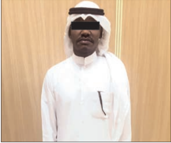
المتهم قبل إحالته إلى النيابة العامة