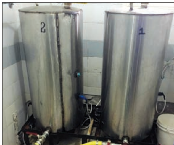
ادوات تصنيع وتقطير ضبطت في الوكر

ج.م هندي الجنسية وكان بحالة غير طبيعية وعند تفتيشه احترازي تبين انه في جيبه الايمن، عدد 2 كيس يشتمه بها مواد مخدرة (هيروين)، عدد 1 «زقارة» يشتمه بها مواد مخدرة (حشيش)، وبالتحقيق معه اعترف بترويجه المخدرات لحساب نزيل وتعاطيها ايضا وتمت إحالته الى جهة الاختصاص.