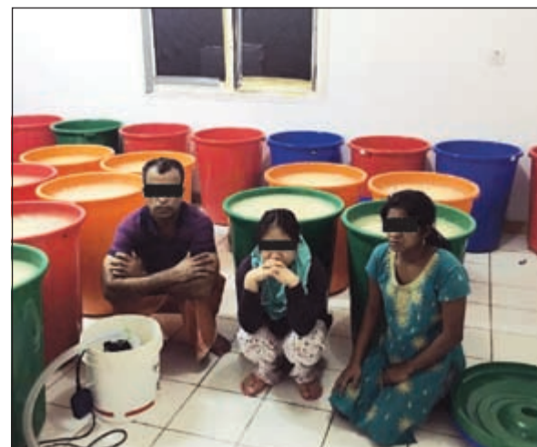
الموقوفون والمضبوطات في مصنع الوفرة

عبدالله سفاح الى مكافحة المخدرات سائق أسبوي واثناء تجوال دورية نتبع امن الاحمدي في نفس منطقة الرقة حيث تم استيقاف تاكسي وبداخله المدعو