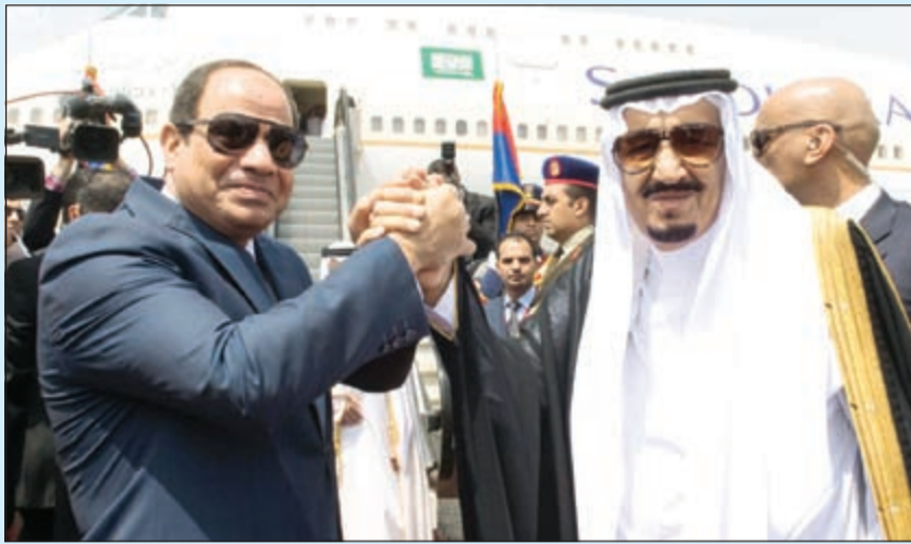
الرئيس عبدالفتاح السيسى مودعاً الملك سلمان بن عبدالعزيز بيد واحدة في مواجهة التحديت (واس)

اختتمت زيارته التاريخية لمصر وتوجه إلى تركيا لحضور القمة الإسلامية جامعة القاهرة تمنح الملك سلمان الدكتوراه الفخرية