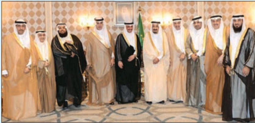
خادم الحرمين الشريفين الملك سلمان بن عبدالعزيز خلال استقباله رئيس مجلس الأمة مرزوق الغانم والوفد البرلماني في القاهرة أمس

اختتمت زيارته التاريخية لمصر وتوجه إلى تركيا لحضور القمة الإسلامية جامعة القاهرة تمنح الملك سلمان الدكتوراه الفخرية