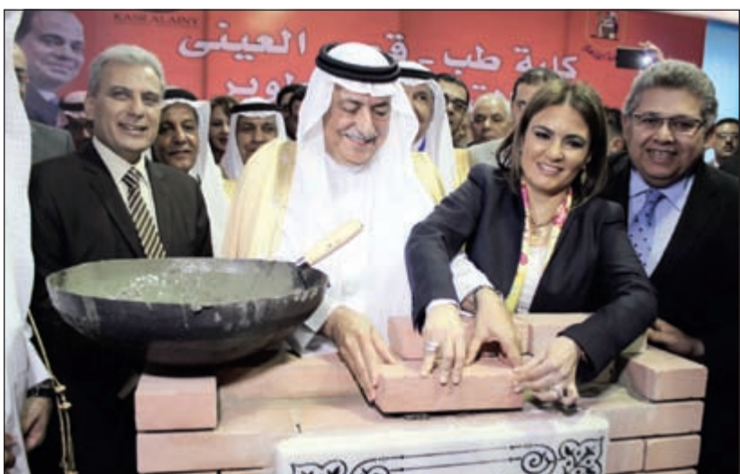
د. إبراهيم العساف ود. سحر نصر يضعان حجر الأساس