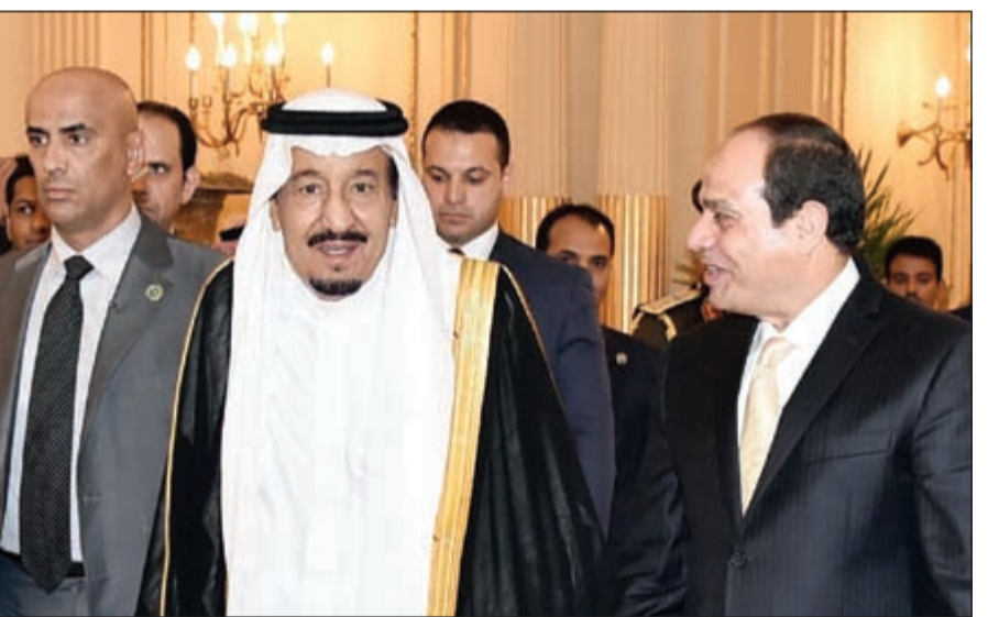
الرئيس عبدالفتاح السيسي مستقبلا الملك سلمان بن عبدالعزيز في قصر عابدين

12 - التوقيع على محضر اللجنة السعودية المصرية المشتركة، وقعتها من الجانب السعودي. د. توفيق بن فوزان الربيعية وزير التجارة ومن الجانب المصري م. طارق قابيل وزير التجارة والصناعة المصري.