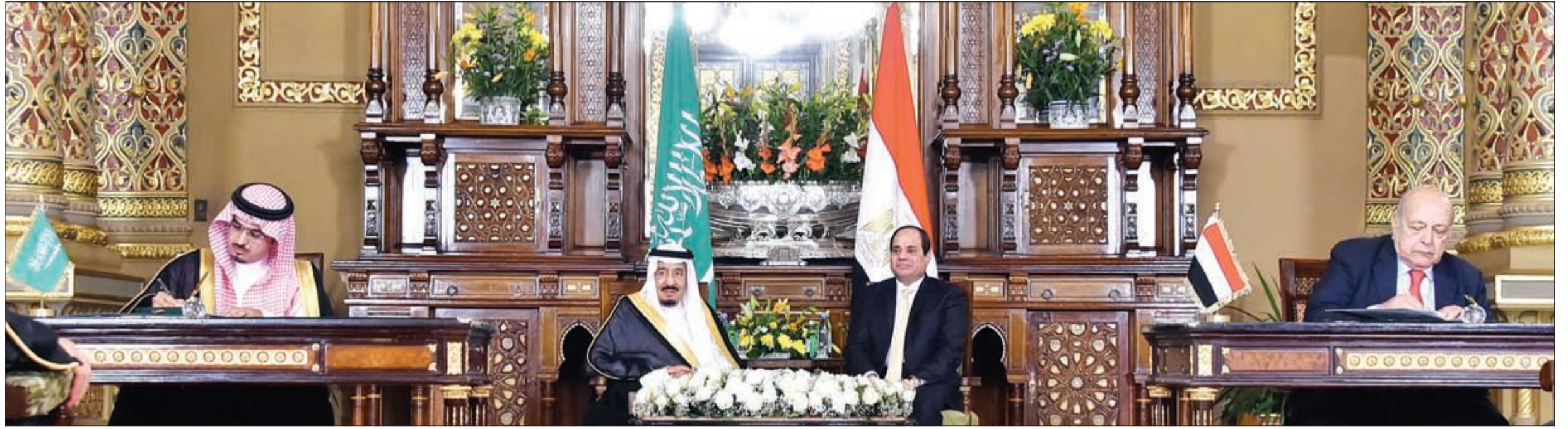
خادم الحرمين الشريفين الملك سلمان بن عبدالعزيز والرئيس عبد الفتاح السيسي أثناء متابعة توقيع اتفاقيات شراكة بين الرياض والقاهرة

ضمن 21 اتفاقية ومذكرة تفاهم جديدة وقعت في قصر عابدين