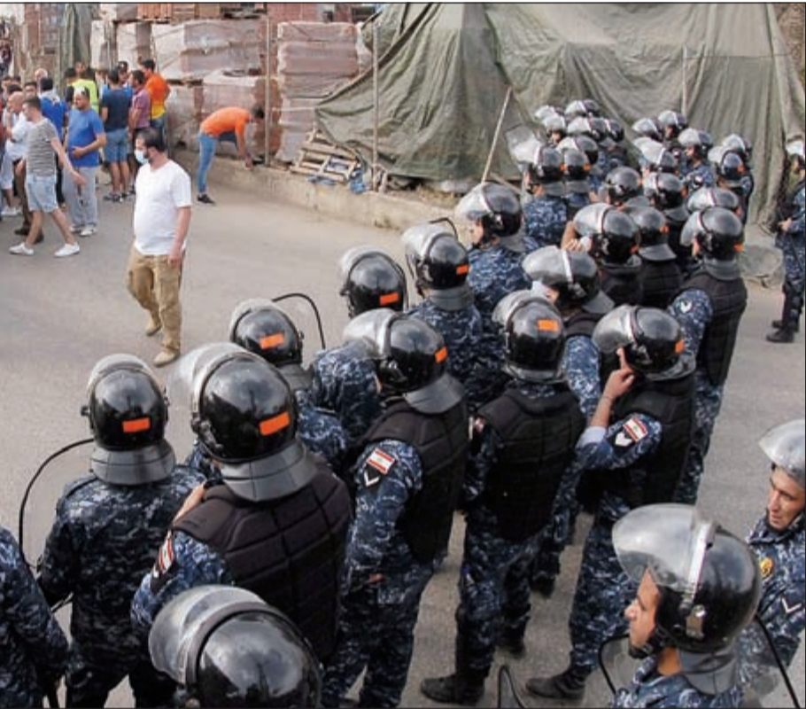
أهالي حارة الناعمة يعتمسون امام مدخل مطمر النفايات تحت شعار «ما هجرتونا بالحرب رح تهجرونا من ورا زياتك»

والسؤال الآن: هل ستتمل جلسة مجلس الوزراء حلحلة ملف جهاز أمن الدولة؟ لا اجزاء حاسمة حتى الآن، وان كان تحديد موعد الجلسة يشير إلى ملامح تسوية مفروك أنضاجها للاتصالات الجارية ومعها ملف أمن المطار وتجهيزاته المختلف على تلزيهها. وهنا، تابع وزير السياحة ميشال فرعون جولته على الوزراء المسيحيين، والتقى رئيس حزب الكتائب سامي الجميل في بكفيا، في إطار اجساد الحلول لأزمة جهاز «أمن الدولة»، وكان التقى