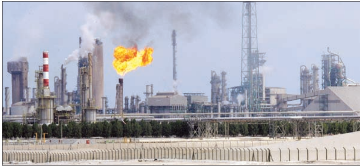
الكويت تقدم خصومات للنفط المصدر إلى آسيا وأوروبا وأميركا للفوز بأكبر حصة سوقية

وذكر المصدر ان التخفيضات الحالية لسعر النفط تعتبر «معقولة» في ظل الطلب الموسمي على البنزين وتحسن هوامش التكسير، مشيراً الى ان الجميع يترقب تحسن الاسعار عقب اجتماع الدوحة المقبل في 17 أبريل الجاري لتثبيت