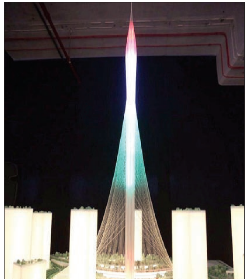
مجمّع البرج الجديد

أعلنت شركة إعمار العقارية، امس، عن العناصر الهندسية والمعمارية للبرج الكائن في مشروع خور دبي، والذي يمثل المحور الرئيسي لمشروع خور دبي الممتد على مساحة 6 كلم مربعة.