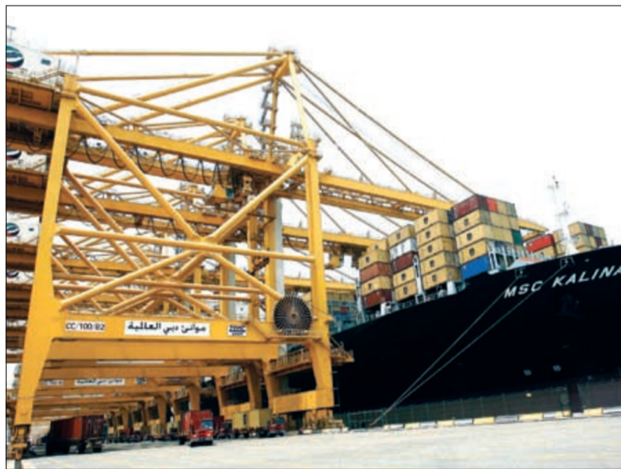
دول الخليج تستعد لعهد جديد من العلاقات التجارية مع أميركا بعد انتخاب رئيس جديد للولايات المتحدة

أما دونالد ترامب وبرغم كونه رجل أعمال، إلا أنه خسر الكثير من العلاقات مع اصداقائه في المنطقة بسبب إعلانه المثير للجدل «حول حظر كامل لدخول المسلمين الولايات المتحدة».