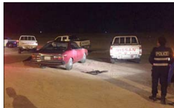
الحملة التي شهدها الطريق الأصفر في كبد