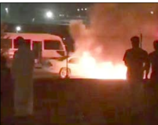
النيران آتت على المركبة