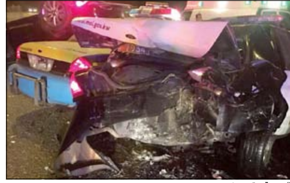
الدورية وقد تهمت