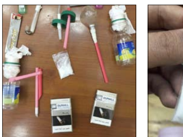
كمية المنوعات التي تم التحفظ عليها