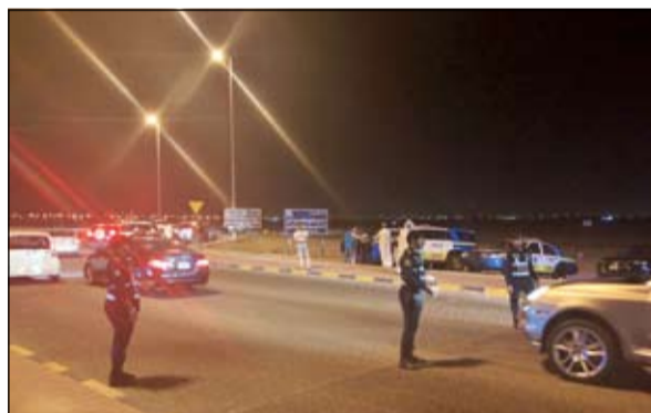
رجال المرور خلال الحملة