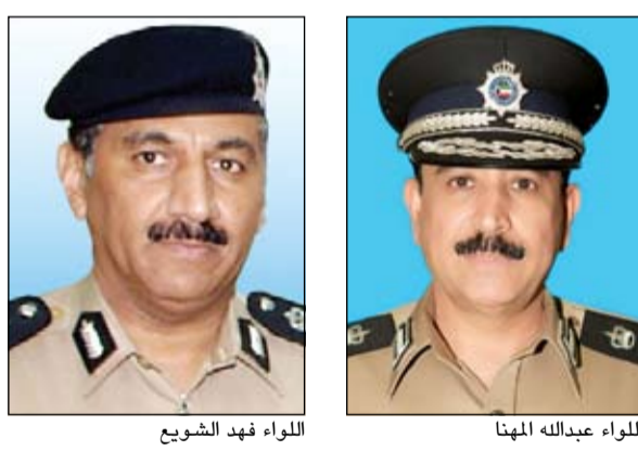
اللواء فهد الشويح

شُرّ رجال المرور حملة بتعليمات من الوكيل المساعد لشؤون المرور اللواء عبدالله المهنا ومساعدته اللواء فهد الشويح على الطريق الأصفر الواقع في منطقة كبد بقيادة العقيد يوسف الخدة، وتم ضبط 4 مركبات وإحالتها الى الحجز، كما تم تحرير عدد من المخالفات. وقال مصدر أمني: إن رجال المرور قاموا برصد أحد الحساسيات الشخصية التي تحت على الاستهتار، وتم رصد الموقع وفض التجمهر، كما أشار المصدر الى ان رجال المرور وأثناء الانتشار الأمني في جميع المحافظات تم تحرير 3989 مخالفة وحجز 366 مركبة، بالإضافة الى حجز 7 دراجات نارية، هذا، وقال المصدر: إن رجال المرور مستمرين بالحملة المرورية التي تأتي بتوجيهات الفريق سليمان الفهد.