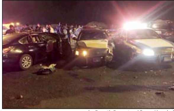
الحادث المروع الذي شهده الدائري السابع