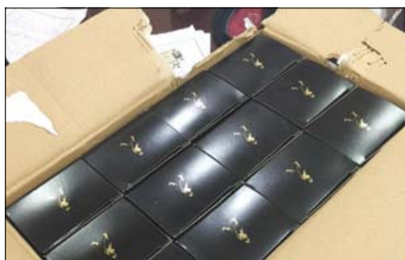
كمية أخرى من المستوردة