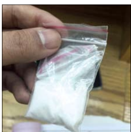
الشيبو في قبضة الأمن