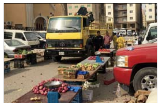
سوق الخضار الخالف