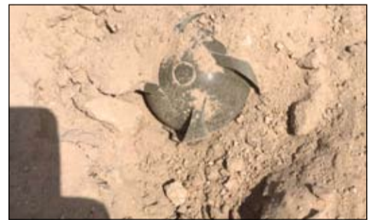
اللغم الذي عثر عليه