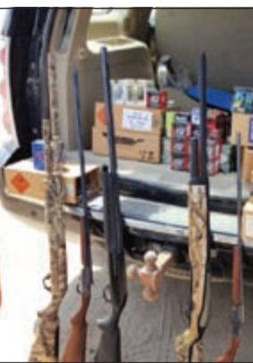
الاسلحة التي تم ضبطها

شن رجال الإدارة العامة لمباحث السلاح بقيادة العميد عبدالرحمن الصليل ومساعدته العقيد وليد الشهاب أمس حملة نوعية استهدفت جزيرة فيلكا، وأسفرت الحملة التي جاءت بدعم وأسناد من قبل قطاع خفر السواحل عن ضبط 25 شوزن غير مرخص ومكسبة من الذخيرة، وضبط خلال الحملة النهارية 14 مواطناً عثرت بحوزتهم على هذه الأسلحة. وقال مصدر أمني ان رجال مباحث السلاح بصدد إحالة جميع الموقوفين الى النيابة العامة بنهم حيازة أسلحة وذخيرة دون ترخيص.