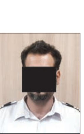
الموظف بعد القبض عليه

شؤون الإقامة والبحث والتحري ومخاطبة الانترنت جاء الرد بان المذكور أعلاه دخل مصر قادماً من الإمارات، ومخاطبة إدارة جوازات المطار تم الحصول على تذكرة دخول الطائرة الصادرة له. وتبين ان الختم يخص الموظف «د. س» وهو من موظفي الجوازات، حيث تم ضبطه والتحقيق معه، وتمت إحالته الى النيابة العامة، وسجلت ضده قضية جنائية تزوير في كشوف المغادرين والقادمين.