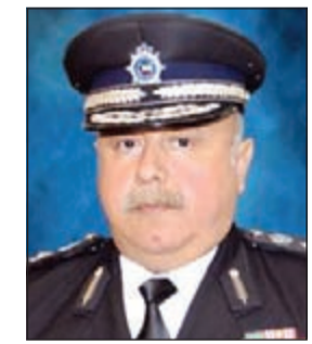
الفريق سليمان الفهد