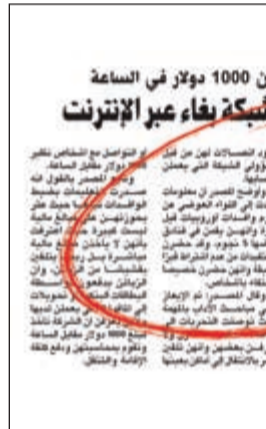
صورة زكوغرافية للخبير الذي نشرته «الأنباء» حول القضية