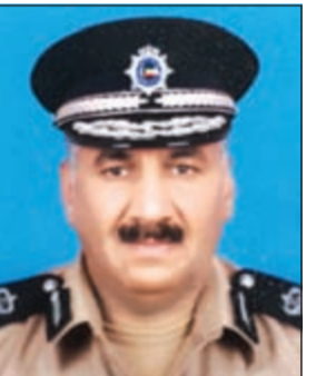
اللواء فهد الشويح

اشترتها منها بالأقساط ورغم عدم اكتمال سداد القيمة الا انه جرى تحويلها باسماء السوريين وخروج بعضها خارج الكويت. وقال المصدر الأمني ان الموظف تقاضى مقابل لهذا التزوير، ونشر المعلومات الى ان عدة شركات تعرضت لهذا الأمر وجار حصرها، مشيراً الى ان قيمة الشاحنات تفوق المليون وربع المليون دينار. وقد أشرف على متابعة القضية والإشراف على التحقيقات مدير عام المرور