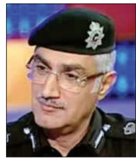
اللواء إبراهيم الطراح