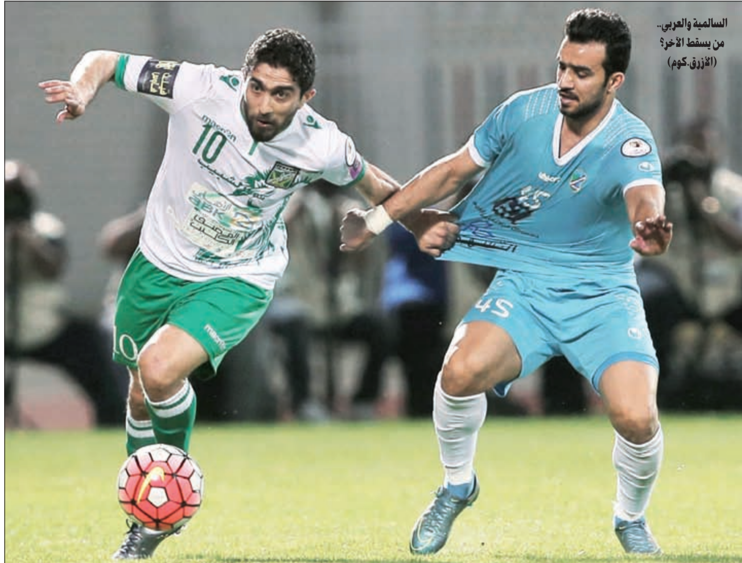
السالمية والعربي.. من يسقط الآخرة (الأزرق، كوم)

كازمة يستضيف الساحل في الجولة الـ 23 لدوري VIVA