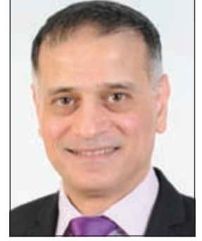
إعداد: د. طارق البكري