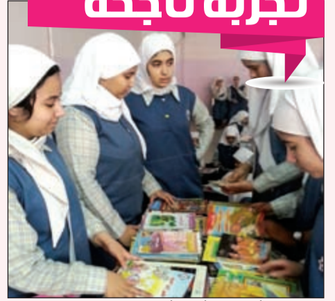
أعطني كتاباً وخذ فكري وعلماً.