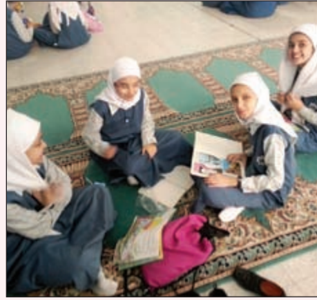
مناقشة مضامين الكتب