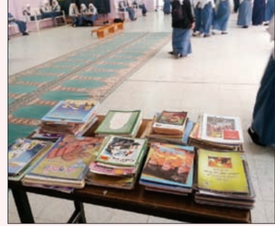
مائدة ثقافية متنوعة

نظم قسم المكتبة في مدرسة النجاة الأهلية المتوسطة للبنات في السالمية يوماً مفتوحاً للقراءة الحرة، وذلك في فترة انشغال المعلمات في يوم خاص بلقاء أولياء الأمور. وكانت الفعالية ناجحة جداً وإيجابية للغاية. وأقيمت الفعالية في باحة المدرسة، وأبدت الطالبات الإعجاب بهذه الفكرة المتميزة، وكانت فرصة طيبة لاستغلال الوقت. وحصدت الطالبات الكثير من القراءات المتنوعة.