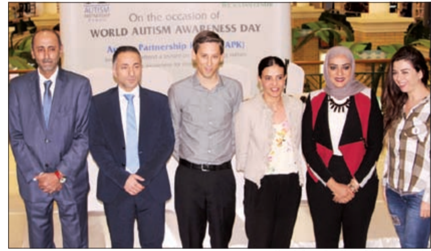
جانب من مشاركة سلطان باليوم العالمي للتوحد

تزامنا مع إحياء اليوم العالمي للتوحد الذي وافق 2 أبريل، نظم مركز سلطان بالتعاون مع مركز شراكة التوحد الكويت، سلسلة من الفعاليات المختلفة وذلك يوم 4 أبريل، حيث كان الهدف الأساسي من هذه المبادرة هو نشر التوعية بحالة التوحد وكيفية الكشف عن أعراضه مبكرا، وطرق علاجه وخلق المعرفة الكاملة بخصوص التوحد والأطفال المصابين به. والجدير بالذكر، أنه كان لهذه الفعاليات تأثير إيجابي حيث ساهمت في التوعية بحالة التوحد وكيفية التعامل مع الأطفال ولقت الانتباه إلى نقاط قوتهم والمساعدة على تنمية مهاراتهم.