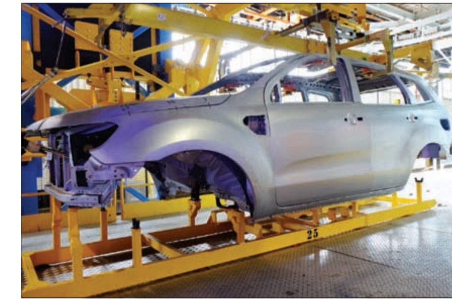
فورد ستصدر إيفرست الجديدة كليا إلى بلدان منطقة أفريقيا جنوب الصحراء

تعقد مجموعة إسكان جلوبل اليوم الأربعاء مؤتمراً صحافياً تهيئدا لإطلاق معرض الكويت الدولي للسيارات والذي تنظمه المجموعة على أرض المعارض الدولية بمشرف خلال الفترة من 12 وحتى 17 ديسمبر المقبل. وأعربت الشيخة فاطمة حمود الصباح رئيس مجلس إدارة المجموعة عن سعادتها بالمعرض الذي ستنظمه المجموعة تحت اسم معرض الكويت الدولي للسيارات على أرض المعارض الدولية بمشرف، وذلك لما تتمتع به قاعات أرض المعارض الدولية من إمكانات كبيرة سواء على صعيد المساحة الواسعة أو مواقع السيارات الرحبة، ناهيك عن مدى الإقبال الكبير الذي تشهده أرض المعارض من قبل مختلف فئات المواطنين والمقيمين، مؤكدة أن هذا المعرض يندرج ضمن المعارض والفعاليات المتعددة التي تنظمها «إسكان جلوبل» على أرض المعارض الدولية، كما يعتبر كذلك إضافة جادة لرصيد خدمات المجموعة التي تقدمها لعملائها في مختلف مجالات الاقتصاد بهدف الإسهام في دفع عجلة الاقتصاد الوطني.