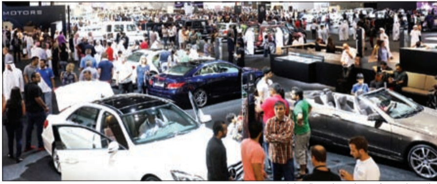
إقبال جماهيري كبير على معارض السيارات