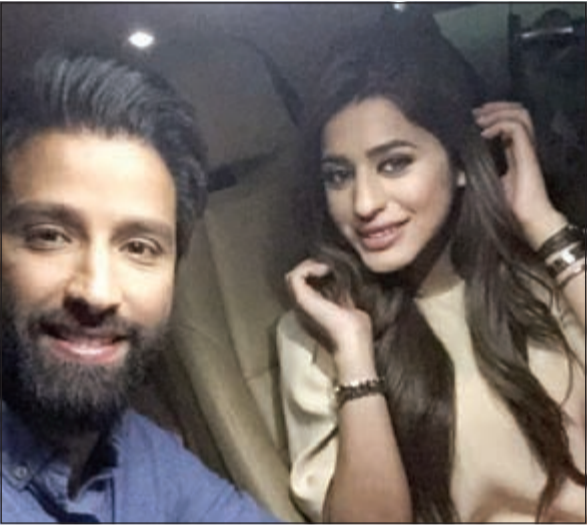
الطليحي وصمود في المسلسل

وعن دوره يقول: أجسد دور العاشق الملياردير «مرزوق» الذي يحب ويعشق