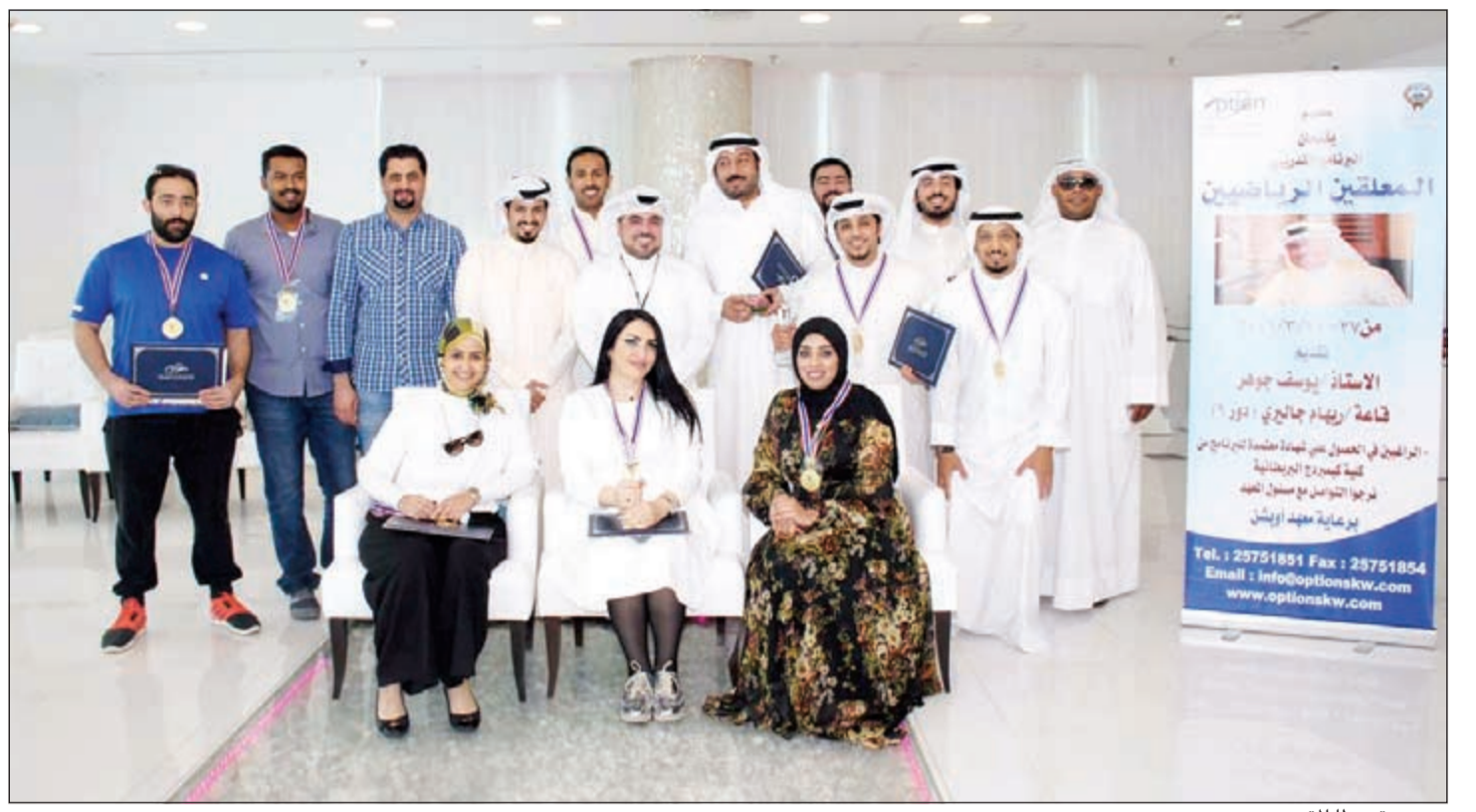
جوهر متوسطا المتدربين