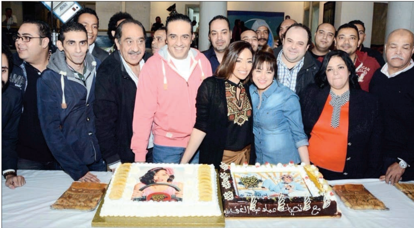
حفل بداية تصوير مسلسل «يوميات زوجة مفروسة»

والمفاجآت أيضاً. وقال المخرج أحمد نور: إن أجواء الصداقة والأسرية الموجودة في لوكيشن التصوير تنعكس بالطبع على الشاشة وكانت واحدة من أسباب نجاح الجزء الأول، كما عبر عن سعادته بانضمام شركة فيردي للممسلسل، وأكد أنها ستثقل العمل وستكون إضافة واضحة له.