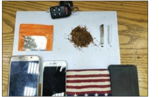
مخدرات وادوات تعاط ضبطت في حملات الأمن العام