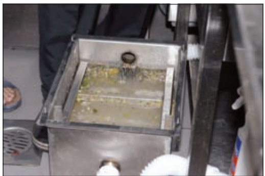
زيوت ملوثة استوجبت تحرير مخالفات بيئية