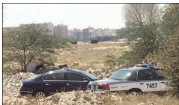
المركبة التي شهدت وفاة الوافدة ومواطنها