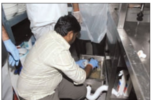
الدھون تضخ في الصرف الصحي

تمكن «قسم الرقابة والتفتيش» بالتعاون مع وزارة الأشغال العامة، والهيئة العامة للبيئة خلال جولة تفتيشية مفاجئة على عدة مطاعم بأحد المجمعات التجارية بمنطقة صباحان، من تحرير مخالفات لعدد 13 مطعماً، وذلك لقيامها بإلقاء المخلفات «الدهن» بالصرف الصحي وعدم التزام تلك المطاعم باللوائح المعمول بها من قبل وزارة الأشغال والهيئة العامة للبيئة، كما تم أخذ عينات من المصافي للتأكد من عدم وجود بكتيريا وغيرها من الملوثات والتي من شأنها أن تضر المرافق العامة وتم تحويلها إلى جهة الاختصاص.