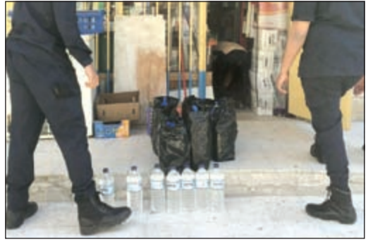
جانب من القناني المضبوطة داخل بقالة «المراهقين»

أعلن مصدر امني مطلع ان قطاع الادلة الجنائية شكل فريق عمل مختصا بالكشف عن اي جوازات مزورة يقدم بها اشخاص الى الكويت عبر مختلف المنافذ، مشيراً الى ان الفريق اكتشف ثغرات في جوازات سفر من دولة عدة، ورفع تقارير بشأن هذه الثغرات الى الاجهزة الامنية والتي بدورها تواصلت مع دول صديقة وشقيقة لإبلاغها بتلك الثغرات والتي بالإمكان ان تستغل من قبل تنظيمات متشددة مثل داعش او جبهة النصرة لتهريب عناصر متشددة تنتمي لها إلى البلدان بقصد القيام بأعمال ارهابية. وإرشد المصدر بالقول: اكتشفنا ثغرات مع بعض الاشخاص من بلدان عدة تشهد اضطرابات وازواضا غير مستقرة، مشيراً الى ان جميع الذين تم توقيفهم على خلفية وجود ثغرات في جوازات سفرهم اخضعوا الى تحقيقات