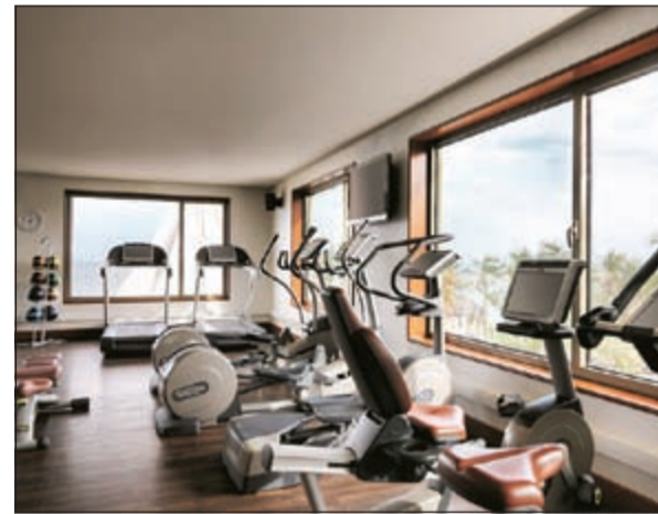
أحدث الأجهزة الرياضية

والتدليل الفاخر. وكجزء من خيارات الطعام الفريدة من نوعها في مطاعم الفندق، يعلن فندق الجميرا شاطئ المسيلة بأنه سيميد «اللبالي الهندية» الشعبية المشهورة في «غاردين كافييه»، وذلك كل ثلاثاء ابتداء من الساعة 7:00 مساء، كي يتبحر لضيوفه فرصة الاستمتاع بتذوق الأطباق الهندية الأصلية المعدة في المنزل، كما يمكن للعائلات التمتع بوجبة برانش مع أفضل الأطباق المميزة كل يوم جمعة في «غاردين كافييه»، وذلك من الساعة 1:00 ظهرا حتى الساعة 4:30 مساء.