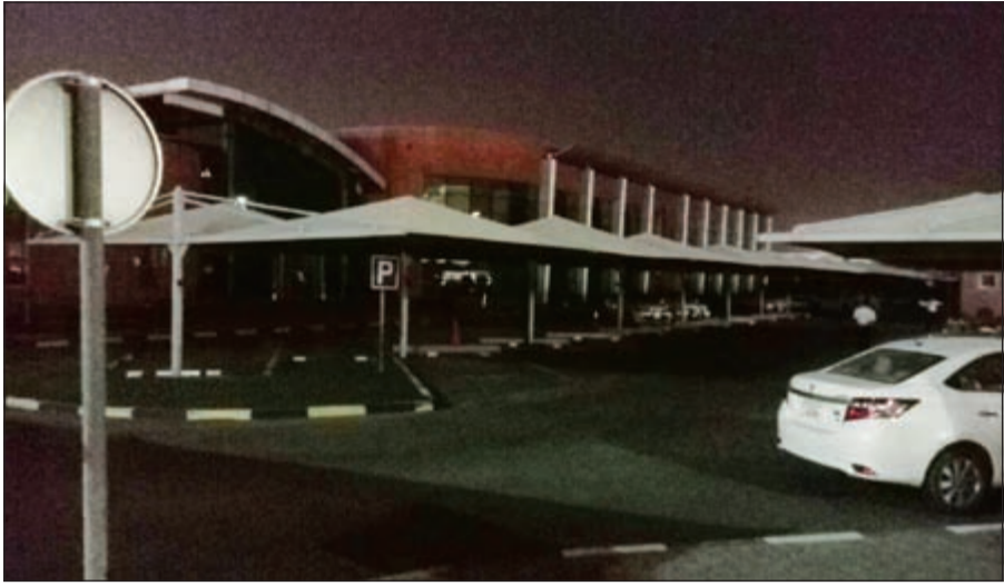
إطفاء الأنوار الخارجية في مباني المجموعة