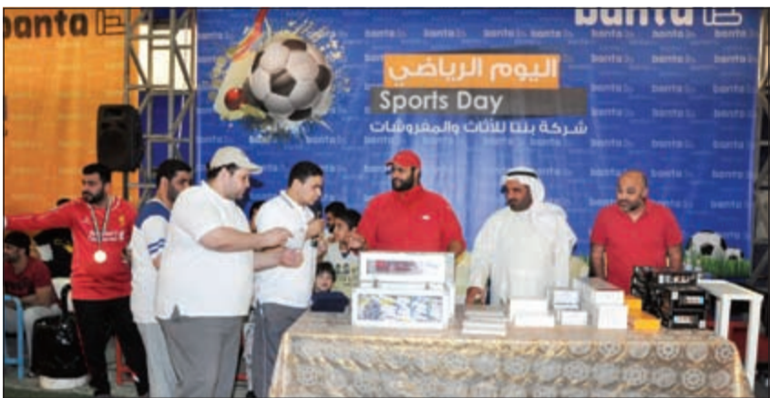
توزيع الهدايا على الفائزين

على الموظفين المتواجدين في هذه الفعالية، كما وعدت إدارة الشركة العليا جميع الموظفين بإعادة تنظيم المزيد من هذه الفعاليات الاجتماعية خلال الفترة المقبلة، وذلك لما مسته من روح المودة التي جمعت بين الموظفين.