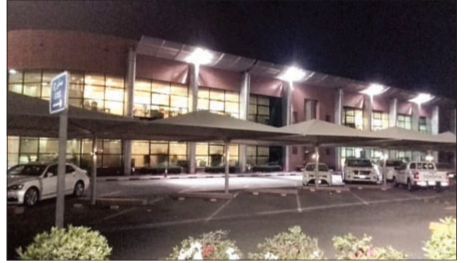
المبنى الخارجي للمجموعة