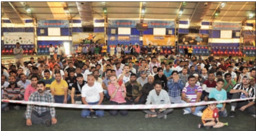
متابعة من الجمهور لانشطة اليوم الرياضي لشركة بنتا (احمد علي)