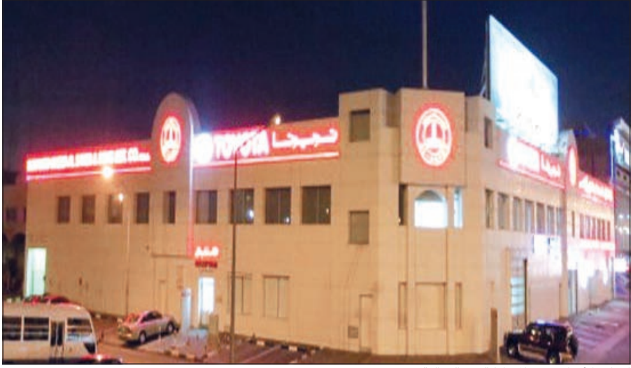
إضاءة الأنوار عقب المشاركة في الفعالية