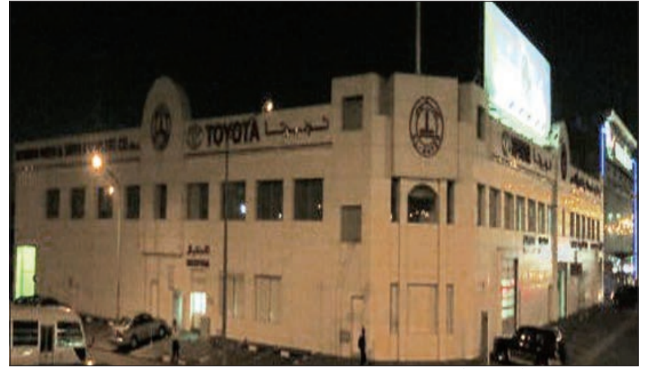
مبنى «تويوتا» وتبدو أنوارها مطفأة خلال المشاركة في ساعة الأرض