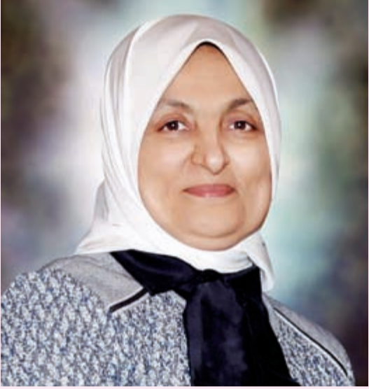
الوزيرة هند الصباح

وزيرة الشؤون الاجتماعية ووزيرة الدولة لشؤون التخطيط والتنمية هند الصباح، حاصلة على بكالوريوس علوم (حاسب آلي وإحصاء)، عملت في إدارة المشاريع وتكوين وإدارة فرق عمل، وإنشاء مراكز المعلومات وإدارة مشاريع الحاسب الآلي، ولها خبرة كبيرة في كراسات المواصفات الفنية وقوانين المناقصات والممارسات وأعدادها، وأعداد التقارير والدورة المستندية للجهات الحكومية وقوانين الخدمة المدنية والمحاسبية، إلى جانب الاستشارات الإدارية والمالية والفنية الخاصة بالحاسب الآلي وميكنة العمليات الإدارية.